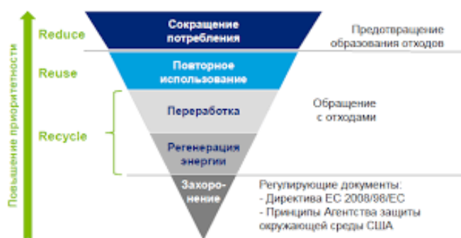
Рис. 1.1 – Иерархия с обращениями отходами

При применении принципа иерархии должны быть приняты во внимание принцип предосторожности и принцип устойчивого развития, технические возможности и экономическая целесообразность, а также общий уровень воздействия на окружающую среду, здоровье людей и социально-экономическое развитие страны.