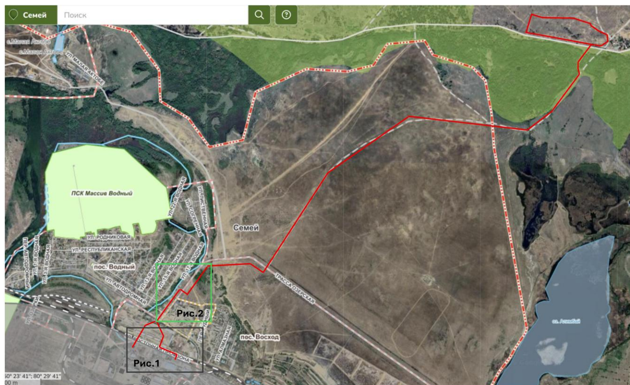
Ситуационная карта-схема проектируемого объекта.