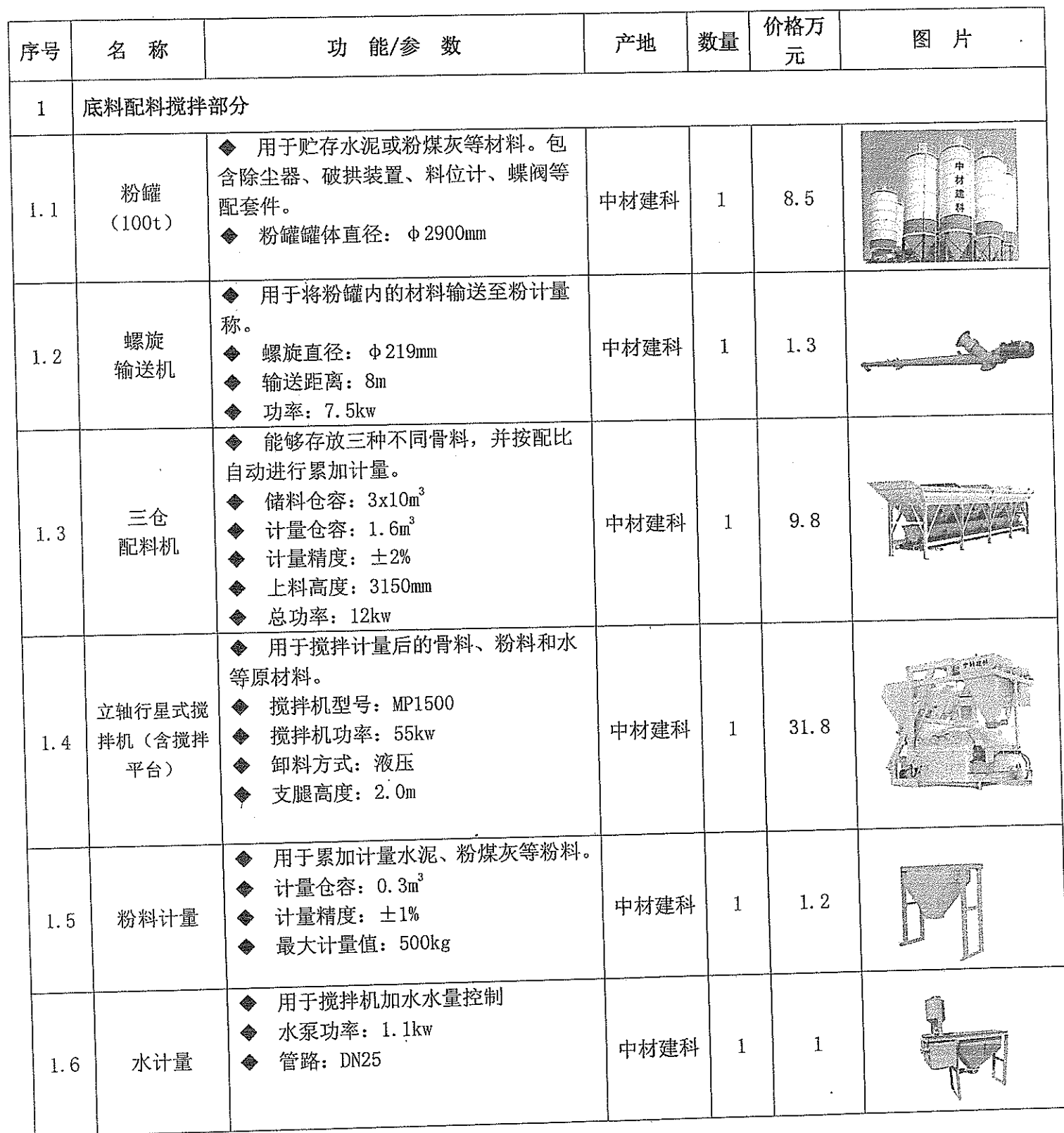
功能参数配置价格表

9、一机多用，通过更换模具可生产不同规格多孔砖、标砖、空心砌块，路缘石、路面砖及植草砖、护坡砖等制品。