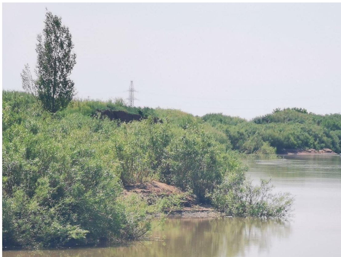
Рисунок 3.1-5 – Заросшая пойма и растительность на берегу