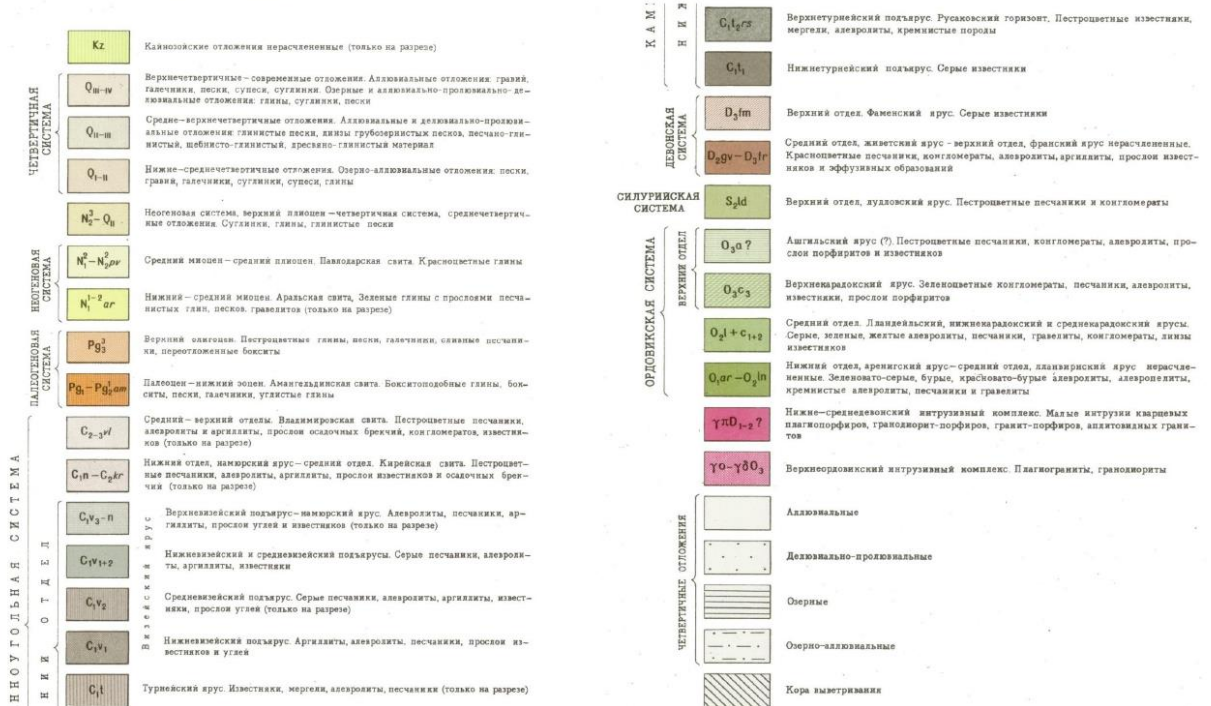
Рисунок 2.5-1 – Гидрогеологическая карта