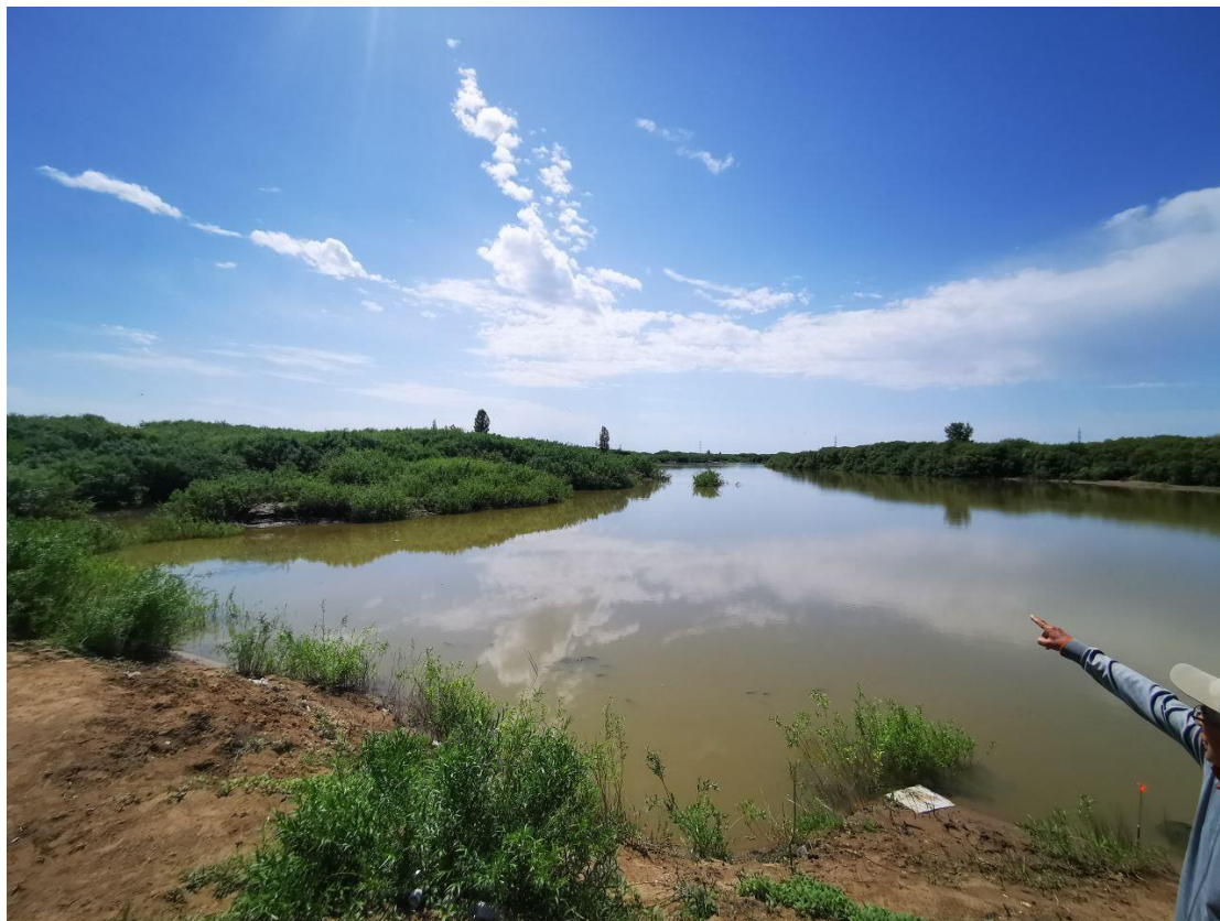
Рисунок 3.1-1 – Русло реки Нура

На нижеследующих фотографических материалах отображены результаты визуального обследования объекта.