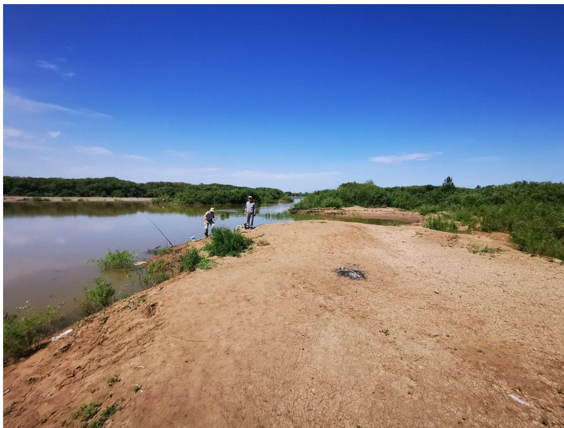
Рисунок 3.1-2 – Правый обрывистый берег в пойме реки