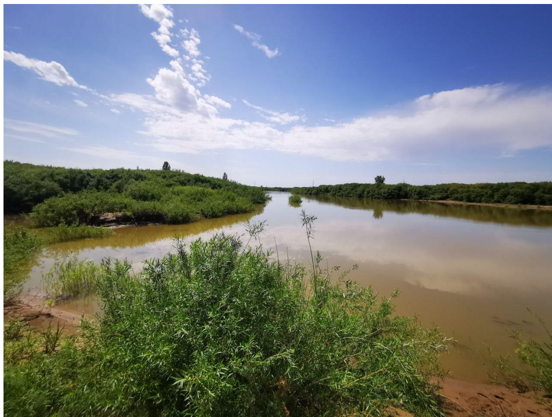
Рисунок 3.1-4 – Заросшая пойма и русло реки