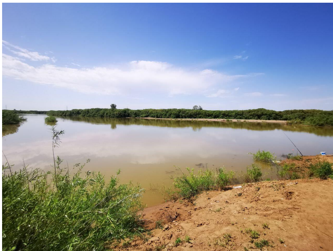
Рисунок 3.1-3 – Вид на пойму реки