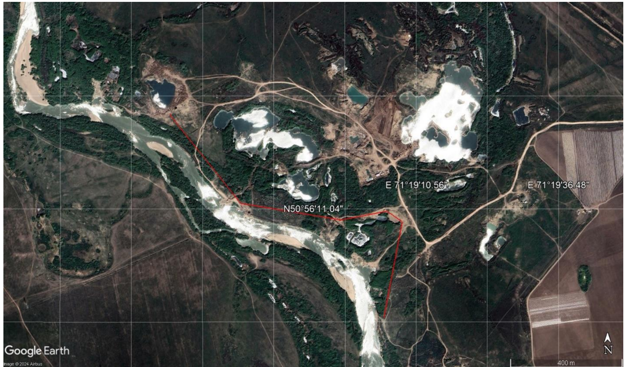
Рисунок 5.4-2 – Месторасположение струнаправляющей дамбы