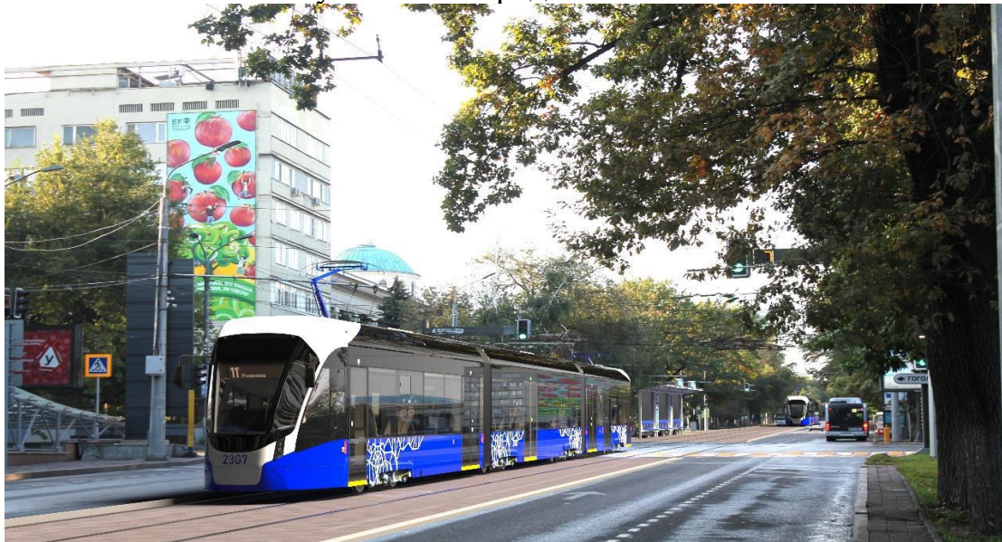
ЛРТ на пересечении пр. Абылай хана и ул. Гоголя

ЛРТ будет являться украшением города, трасса будет объединять центры культурно-бытового обслуживания отдаленных районов и новостроек Алматы с объектами обслуживания городского значения.