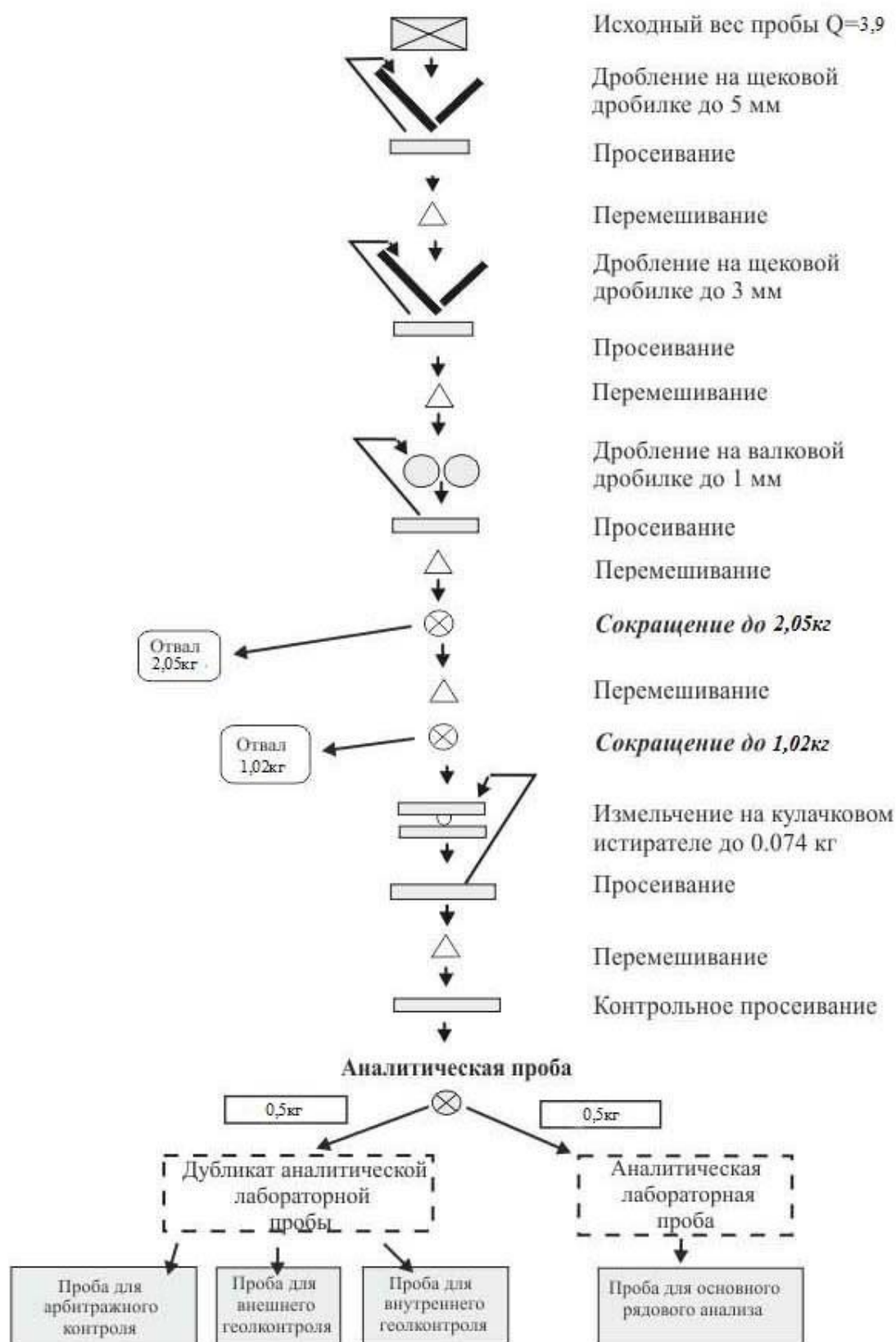
Рис. 4.1 Схема обработки бороздовых и керновых проб