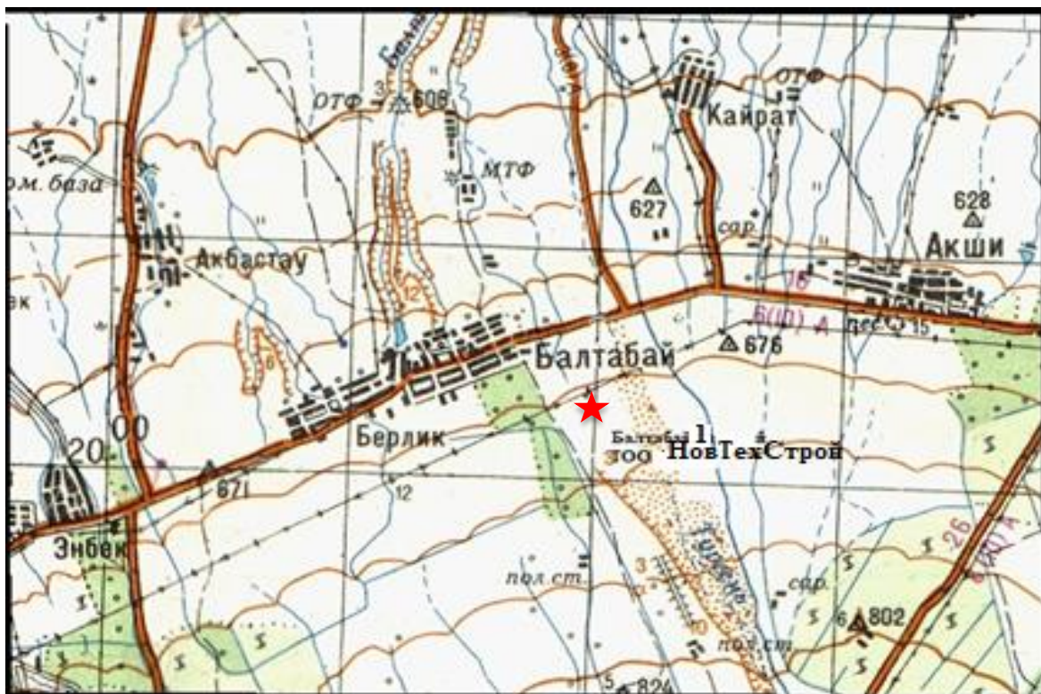
★месторождение ПГС «Балтабай -1» Рис 1