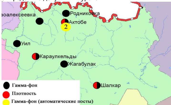
Схема расположения метеостанций за наблюдением уровня радиационного гамма-фона и плотности радиоактивных выпадений на территории Актыбинской области

Среднесуточная плотность радиоактивных выпадений в приземном слое атмосферы на территории области колебалась в пределах 1,0-3,0 Бк/м 2 . Средняя величина плотности выпадений по области составила 1,5 Бк/м 2 , что не превышает предельно-допустимый уровень.