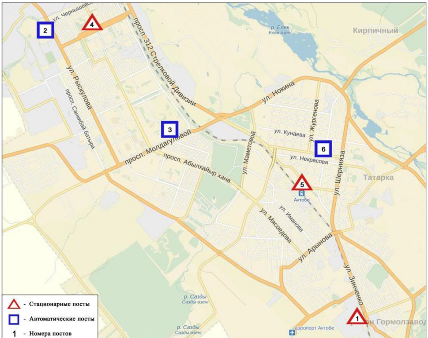
Схема расположения стационарной сети наблюдений за загрязнением атмосферного воздуха города Актобе

Общая оценка загрязнения атмосферы. По данным стационарной сети наблюдений, уровень загрязнения атмосферного воздуха города характеризовался как высокий уровень. Он определялся