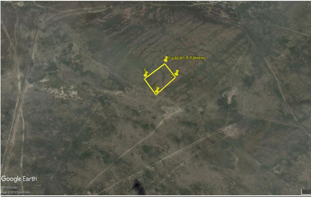
Рис.1.1 Обзорная карта уч.Ушарал-8