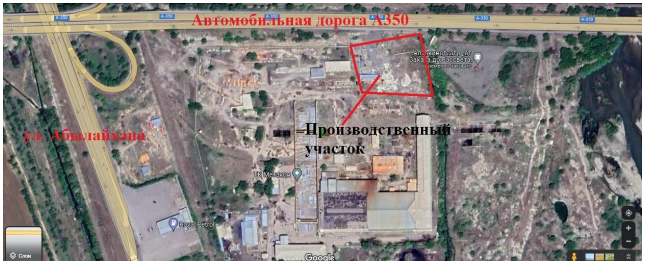
Ситуационная карта-схема расположения участка