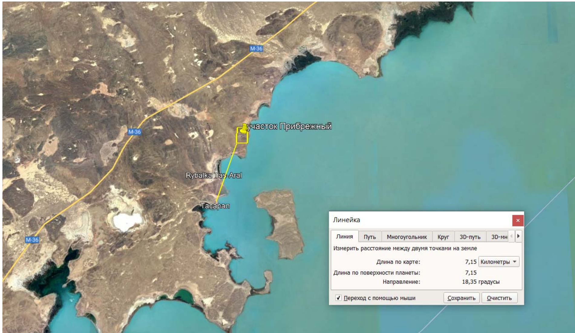
Рисунок 1.2 – Спутниковый снимок промплощадки ТОО «Концерн «Эко-регион СК» с указанием расстояния до ближайшего жилого дома