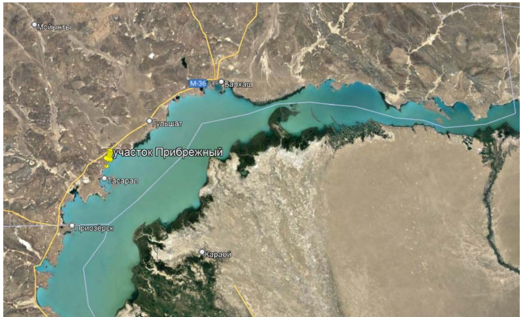
Рисунок 1.1 – Спутниковый снимок промплощадки ТОО «Концерн «Эко-регион СК»