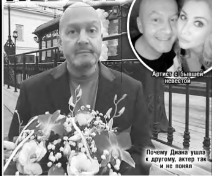
Артист с бывшей невестой