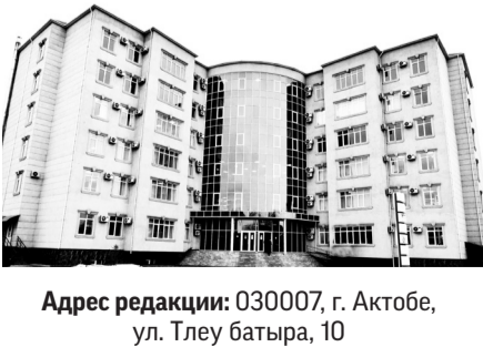
Адрес редакции: 030007, г. Актобе, ул. Тлеу батыра, 10

Мнение авторов публикаций не всегда отражает точку зрения редакции. Письма, материалы, не заказанные редакцией, не рецензируются, не возвращаются и не оплачиваются. За содержание рекламных материалов ответственность несет рекламодатель. Тираж 4 675 Объем 6 п.л. Заказ № 1 514