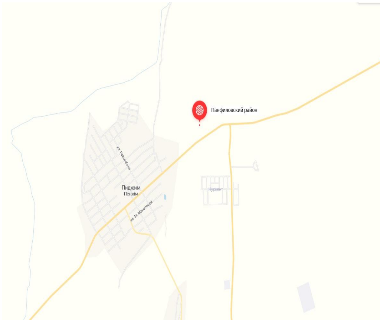
Рис.1. Ситуационная схема расположения проектируемого объекта