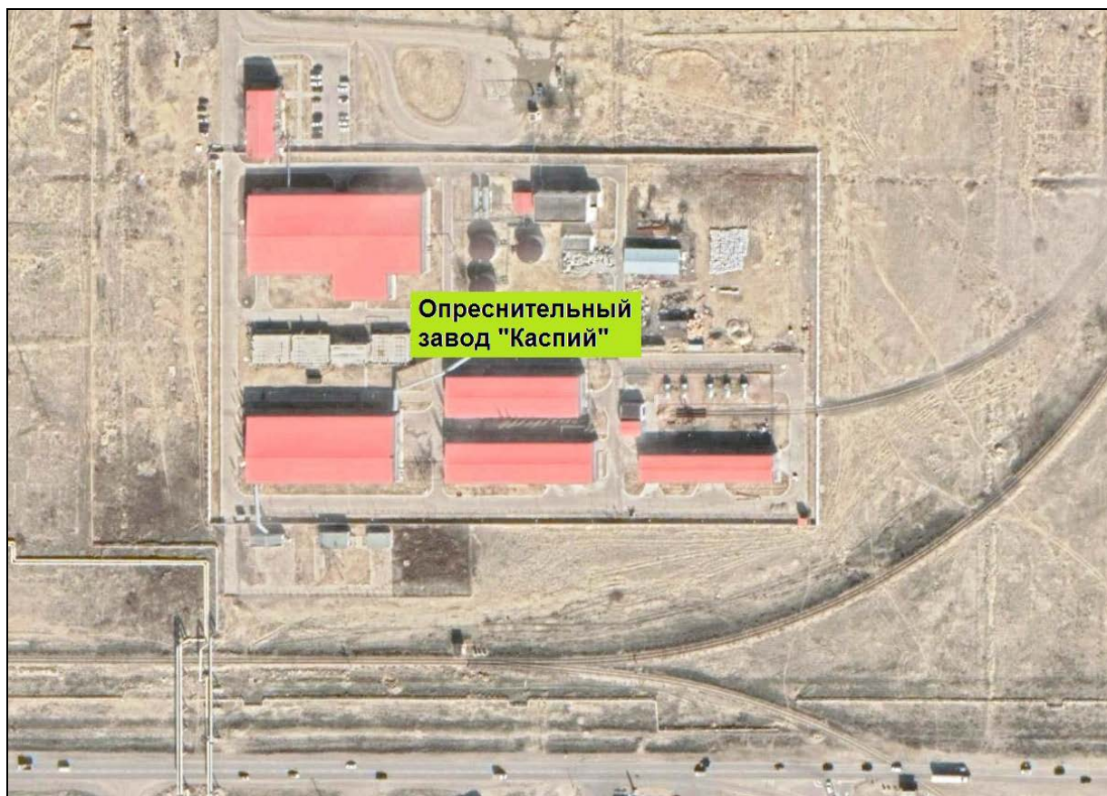
Рисунок 1. Схема территории ТОО «Опреснительный завод «Каспий»

Схема территории ТОО «Опреснительный завод «Каспий» представлена на рисунке 1.