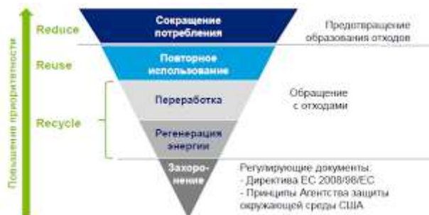
Рис. 1.1 – Иерархия с обращениями отходами.

При применении принципа иерархии должны быть приняты во внимание принцип предосторожности и принцип устойчивого развития, технические возможности и