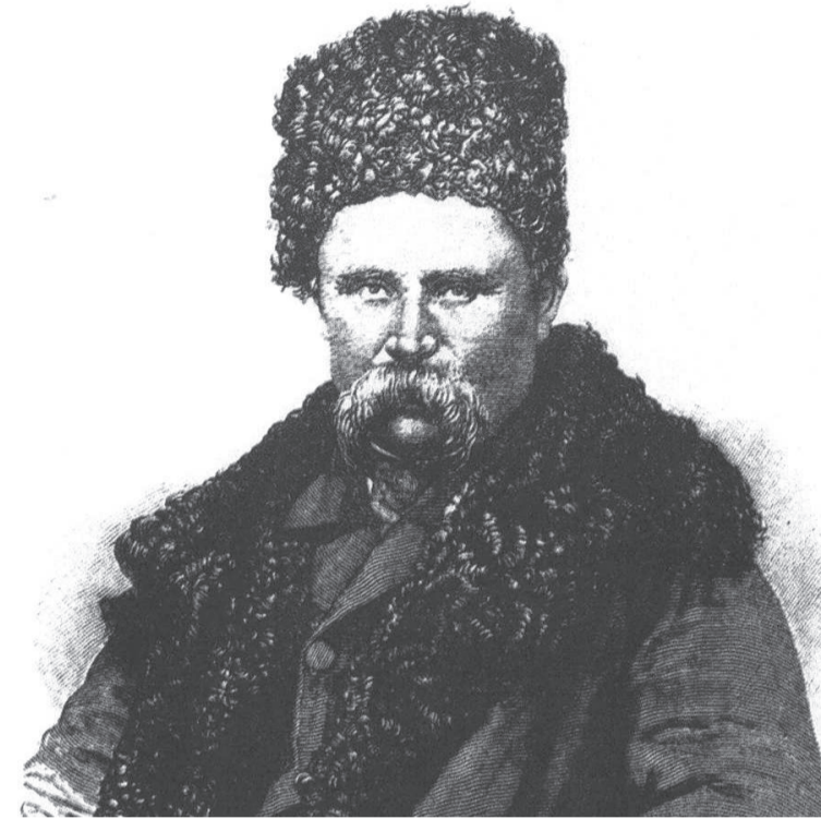
аттанбақ. Мен ол жақты еске алсам, тұла бойым мұздап кетеді. Ал ол болса, сол жерде мәңгі қоныстанып қалуға бар».