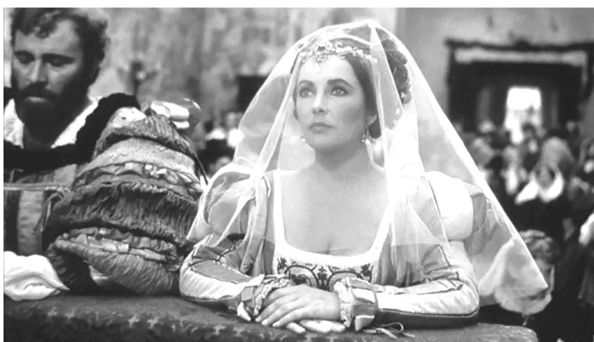
Кадр из фильма «Укрощение строптивой» (1967 год)

Берегите себя и не бойтесь ошибаться, ведь ошибки – важная часть нашего опыта.