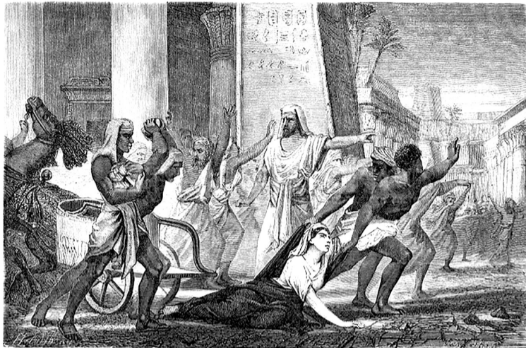
NOÛI DE LA PHILOSOPHE HYPATIE, A ALEXANDRIE

Главное, по чему мы помним Гипатию, — это не ее труды, а ее репутация, вернее миф о ней. Доподлинно известно только то, что, будучи дочерью видного александрийского ученого Теона, Гипатия получила исключительное для тех лет образование, преуспела практически во всех существовавших тогда науках, включая философию, математику и астрономию, а после смерти отца в 405 году н. э. возглавила школу, которую Теон создал при легендарном александрийском Мусейоне, одном из крупнейших религиозных, исследовательских, учебных и культурных центров эллинизма, частью которого была Александрийская библиотека.