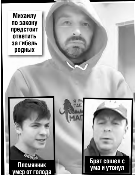
Михаилу по закону предстоит ответить за гибель родных