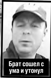
Брат сошел с ума и утонул