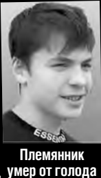
Племянник умер от голода