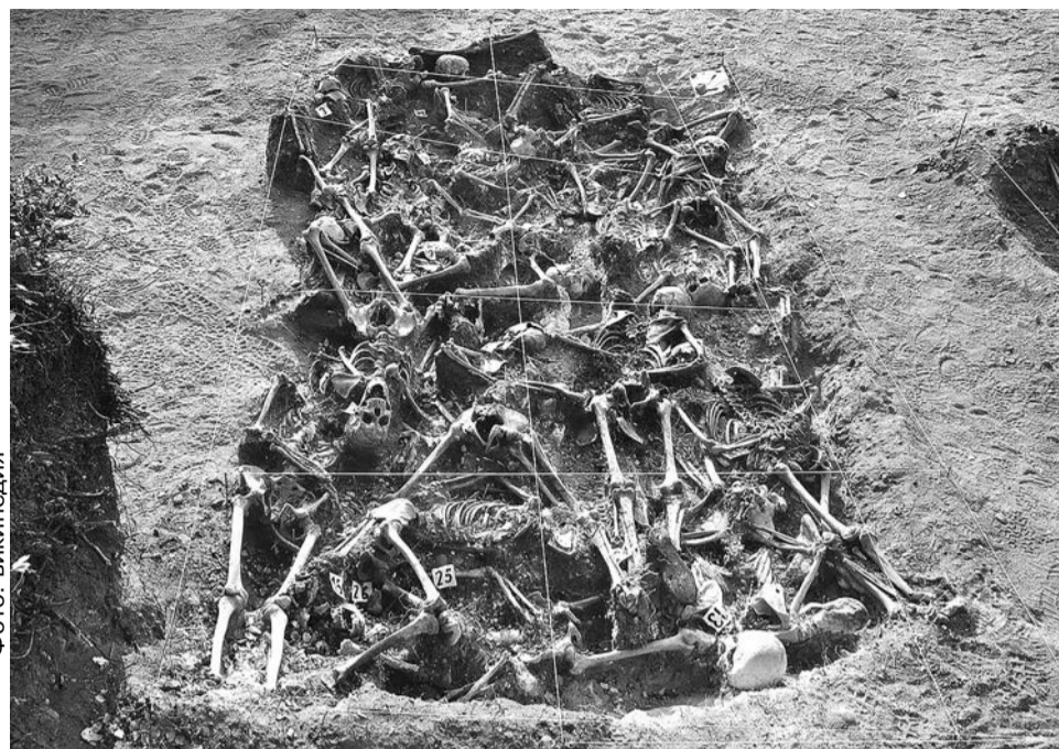
Двадцать шесть республиканцев, казненных франкистами в начале гражданской войны в Испании, похоронены в братской могиле

Книга Оруэлла полна подробностей кровавой, но нелепой войны, в которой однополчане писателя представляются,