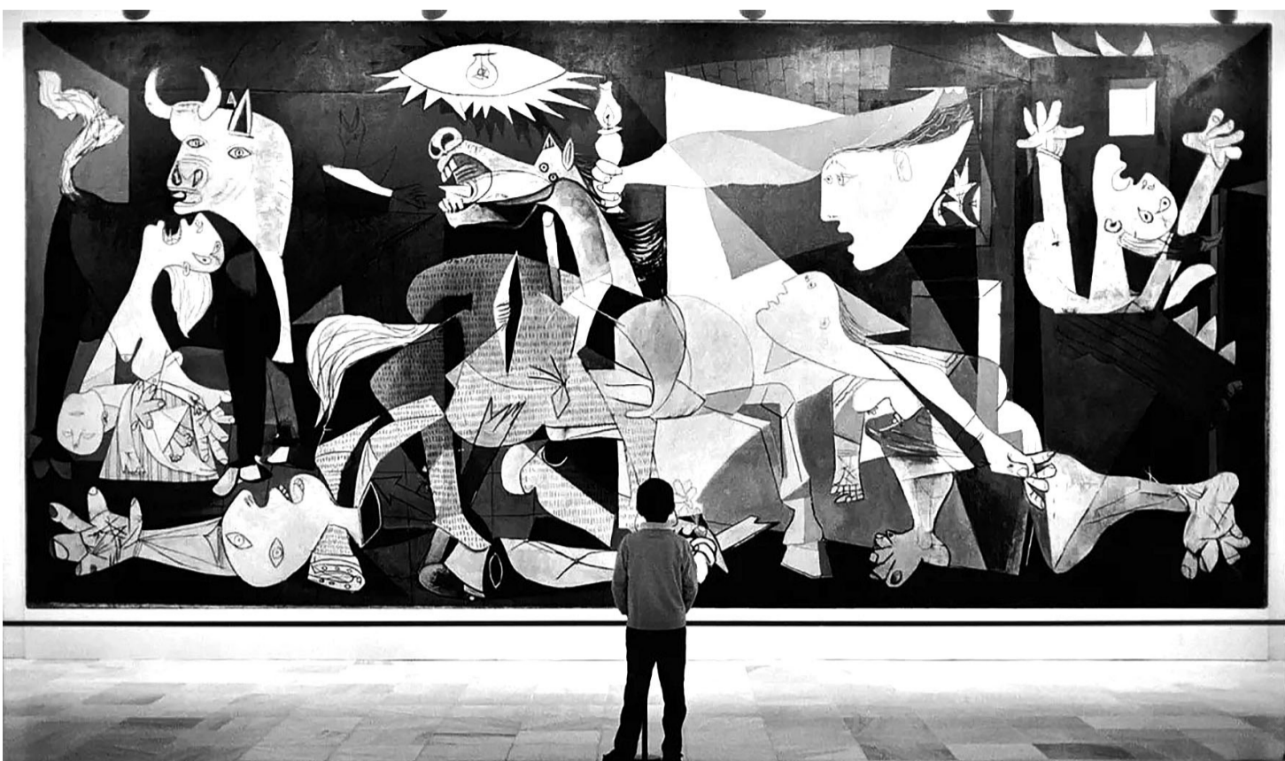
«Герника» Пабло Пикассо в Музее королевы Софии. Мадрид, 1995 год