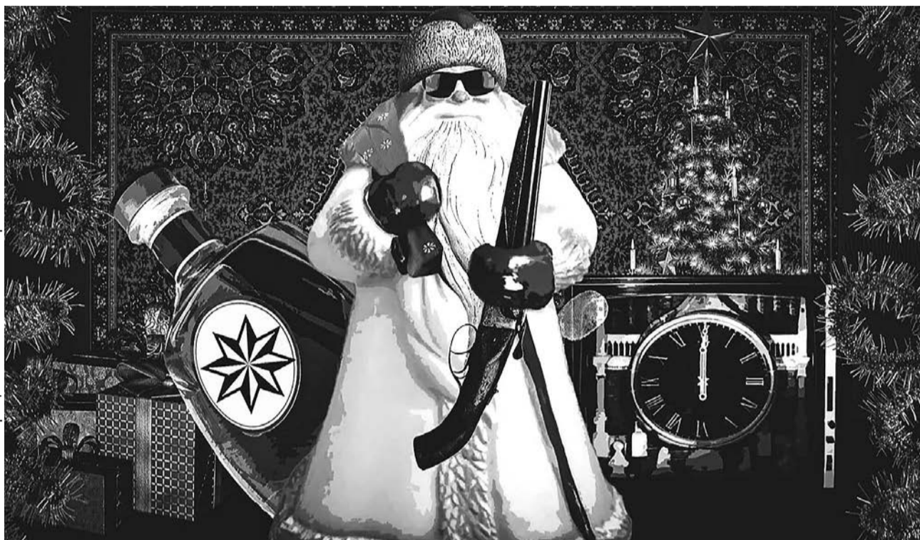
Иллюстрация: «Новая газета Европа»

Но тут его ожидал неприятный сюрприз. Хозяин сразу отнесся к гостю с подозрением. Свою дочь он на зимние праздники отправил к бабушке, и на работе об этом знали. Так что объяснения Деда Мороза о том, что всё оплатил профсоюз, Ишунькин не поверил. Тогда из мешка «дедушки» появился последний аргумент: обрез охотничьего ружья. Под прицелом хозяева послушно сели на стулья и дали себя привязать к ним.