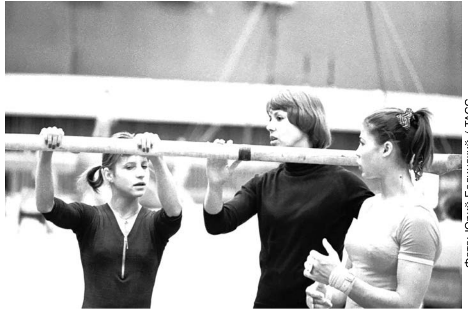
Лариса Латынина (в центре). 1976 год