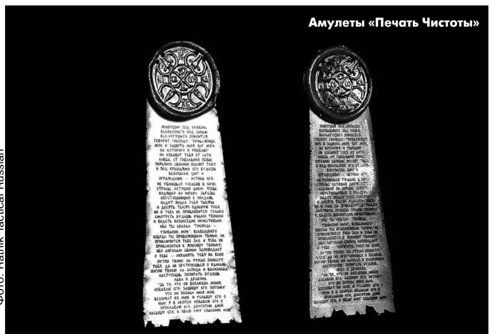
Фото: Ratnik Tactical Russian