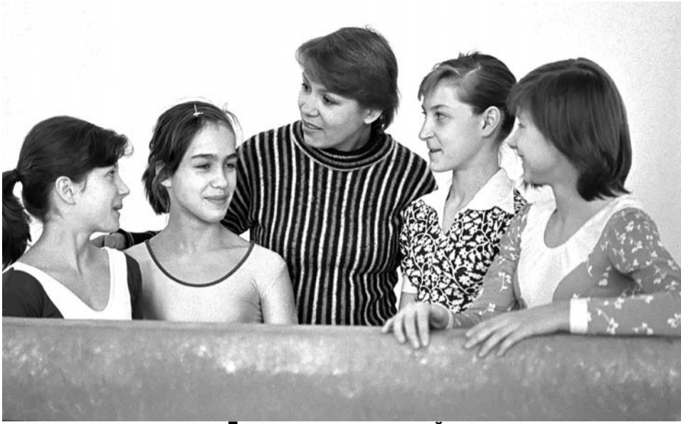
Девятикратная олимпийская чемпионка гимнастка Лариса Семеновна Латынина с юными гимнастками