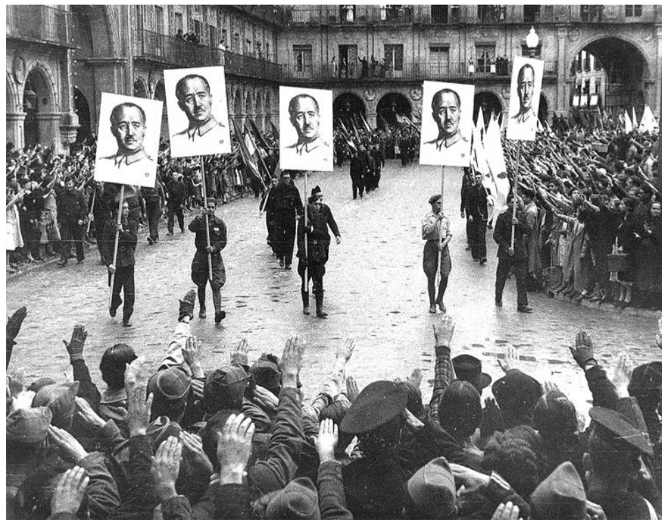
Франкистская демонстрация в Саламанке (1937), участники парада несут знамена с портретом Франко, а население отдает римский салют

Впервые «Гернику» показали в Париже на Всемирной выставке 1937 года. На фоне двух монументальных зданий обеих тоталитарных держав, одно — созданное Альбертом Шпеером, другое — украшенное Верой Мухиной, испанский павильон в стиле Корбюзье походил на легкомысленную беседку для пионерского лагеря. Занявшая всю стену (28 кв. м) трагическая картина Пикассо казалась неуместной и осталась непонятой. Ее символы не были прозрачны и не читались однозначно, как того требовала входившая в моду соцреалистическая эстетика. Но не сразу признали шедевр и мэтры авангардной критики.