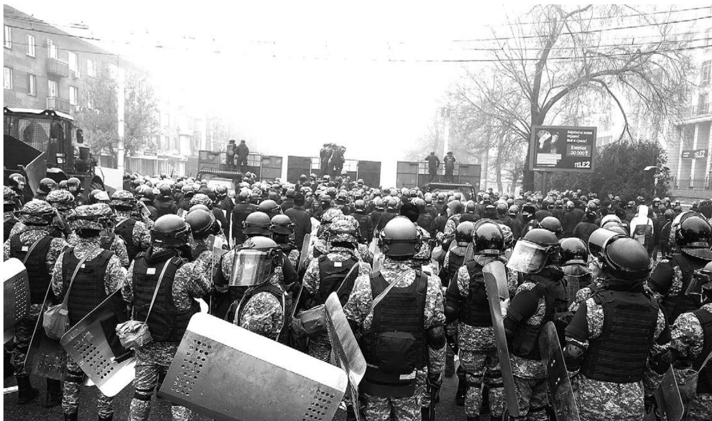
Январские протесты в южной столице 2022 года

P.S. После прочтения свидетельских показаний очевидцев Алматы, у меня возникает ряд законных вопросов, таких как: куда делись тела убитых боевиков, обнаружены ли таковые на балконе 11-го этажа здания на Новой площади, откуда были произведены выстрелы, почему скрываются их имена от общественности, ведь в основном именно эти боевики стреляли по гражданским лицам? Мне кажется, раскрытие их имен дало бы некоторое понимание той ситуации, которая имело место в те дни в Алматы.