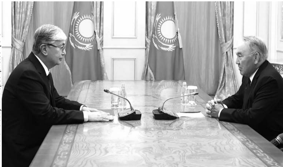
Касым-Жомарт Токаев и Нурсултан Назарбаев

«После ухода в отставку, но оставаясь председателем Совета безопасности, он, надо откровенно сказать, не отличался политической деликатностью, регулярно про-