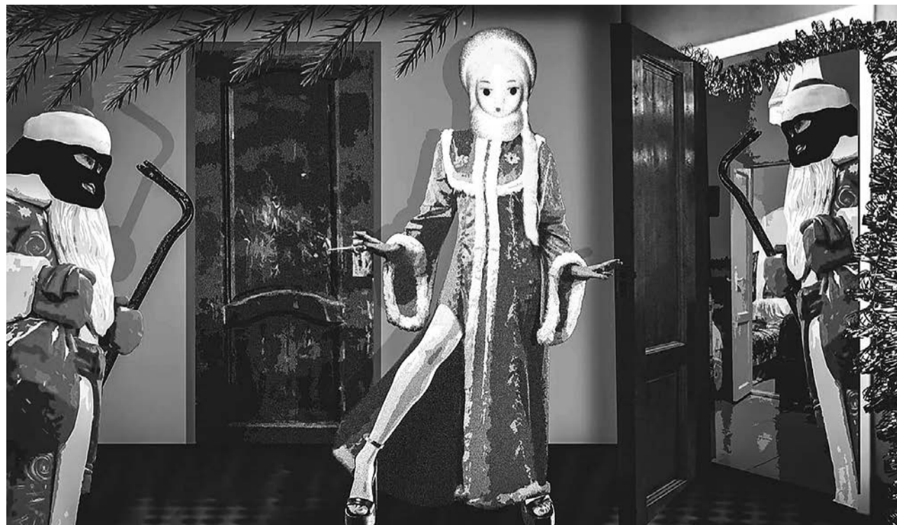
Иллюстрация: «Новая газета Европа»

Сергей ШВЕЦ, специально для «Новой газеты Европа»