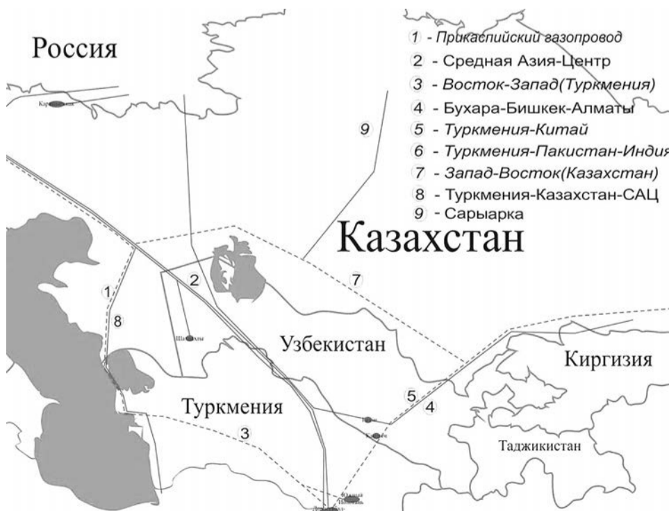
Карта газопроводов, проходящих в том числе через территорию Узбекистана