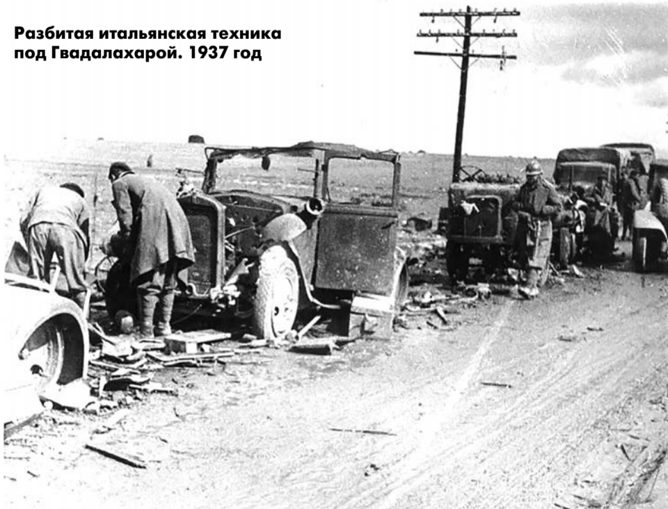
Разбитая итальянская техника под Гвадалахарой. 1937 год

«Я не могу быть сейчас коммунистом, — писал он в письме, — потому что я верю только в одно: в свободу».