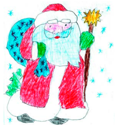
С Новым годом!

Добрый Дедушка Мороз Бородою весь оброс, Он спешит сегодня слишком Вместе с внучкою к детишкам. С неба падает снежок, А у дедушки – мешок. В нем он каждому из нас По подарочку припас. Индира СЕЙТКАЛИ.