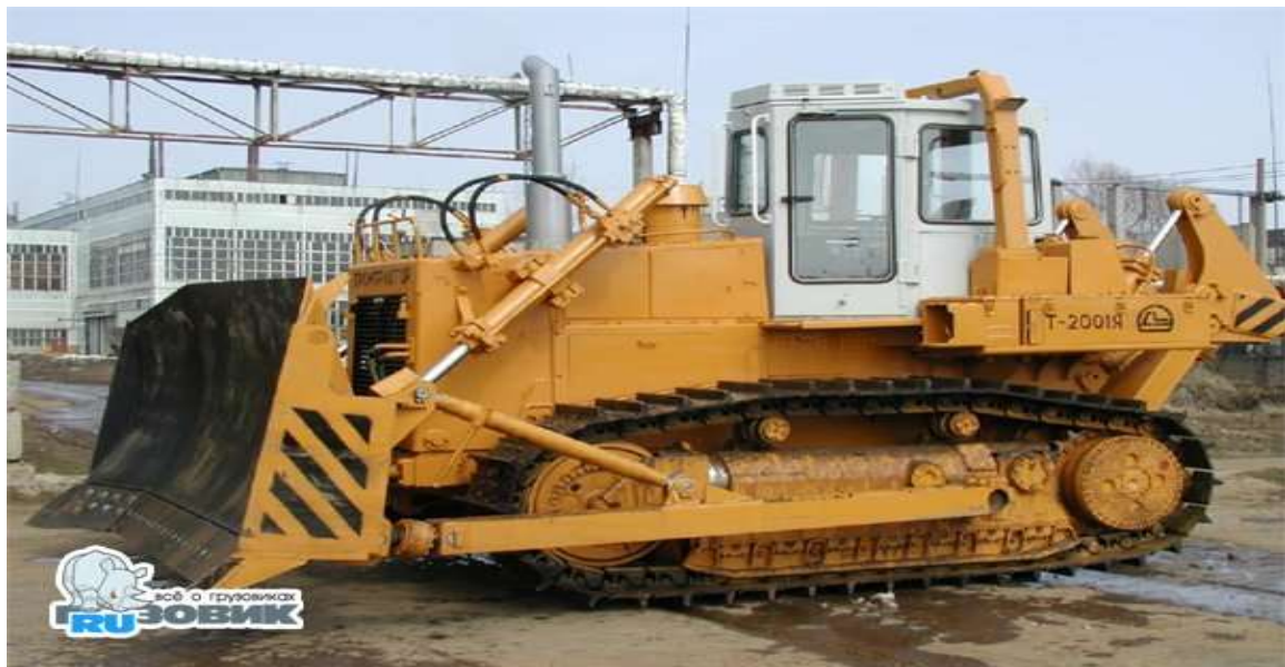
Рис. 4.2 бульдозера-рыхлителя Четра Т-130