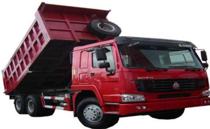
Рис. 4.3 Автосамосвал HOWO ZZ3327

Автосамосвал HOWO ZZ3327 имеет габариты 7356x2496x3386мм, размер кузова – 4800x2300x1400мм, массу без нагрузки 12460кг, грузоподъемность 25т. Максимальная скорость движения самосвала – 75км/час, максимальный радиус поворота – 18,3м, угол подъема – 16°, угол спуска – 26°. Расход топлива составляет 32л на 100км.