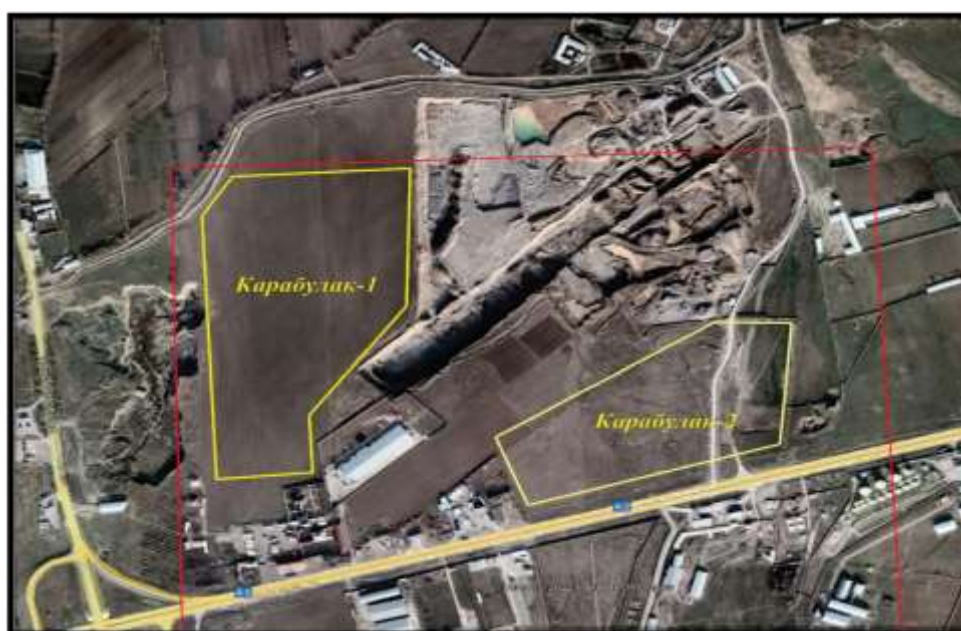
Космоснимок участков работ

Месторождение «Карабулак-2» приурочены к аллювиально-пролювиальным верхнечетвертичным отложениям ( арQ_{III} ).