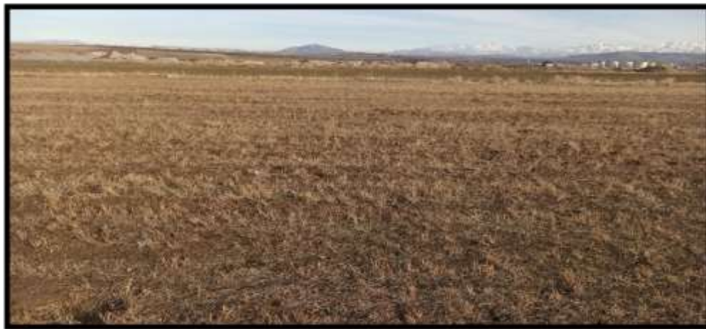
Поверхность участка «Карабулак-2»

Петрографический состав гравия, определённый в лабораторных условиях, представлен осадочными горными породами (98%) - известняками и кремнями; в незначительном количестве, присутствуют изверженные интрузивные горные породы (2%) - сиениты и гибридные горные породы состава лейкократового гранита.