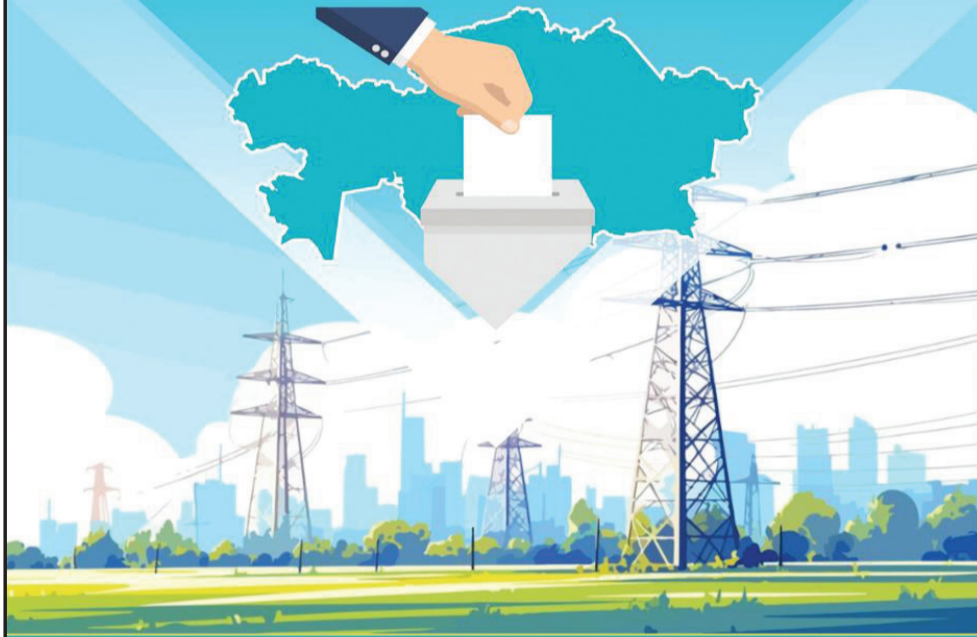
Центральная комиссия референдума Республики Казахстан

Референдум проводится на принципах добровольного участия, свободного волеизъявления, а также всеобщего, равного, прямого и тайного голосования граждан