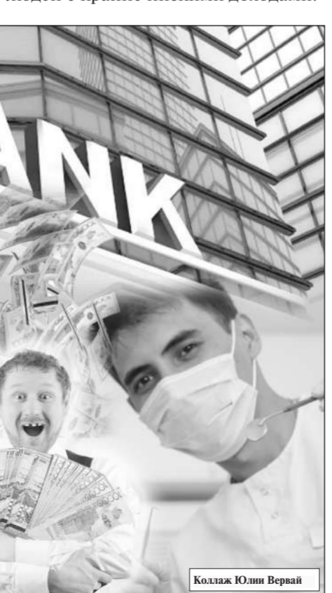
Коллаж Юлии Верной

работы они могут заместить лишь 10-15% от прежнего дохода вкладчика. Таким образом, человек со сред-