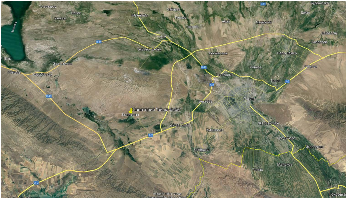
Рис.1 Расположение участка