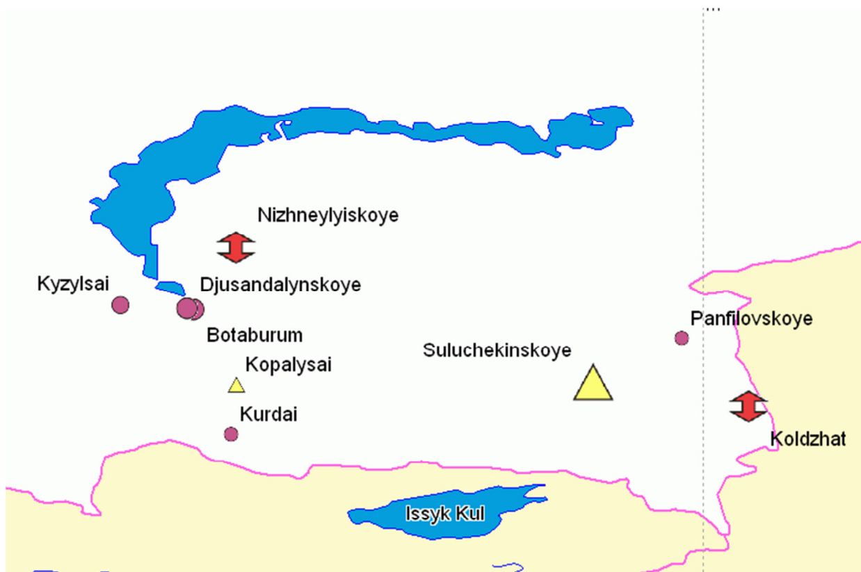
Рис.1.2 Обзорная карта района работ

Территориально относится с Мойынкумскому району Жамбылской области и находится в 15 км к юго-западу от поселка Аксуек, основанного на базе уран-молибденового месторождения Ботабурум (рис. 1.2).