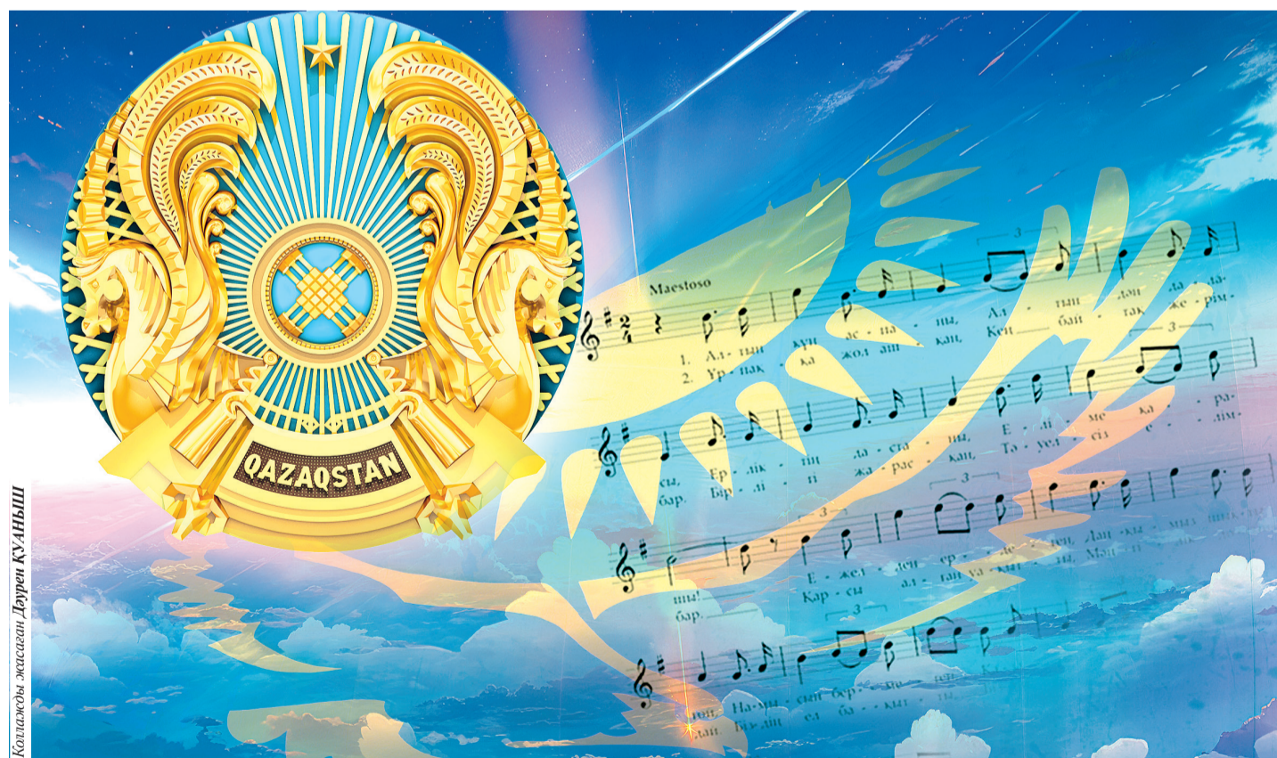
Көпшілігі жасалған Дархан ҚУАНЫШ