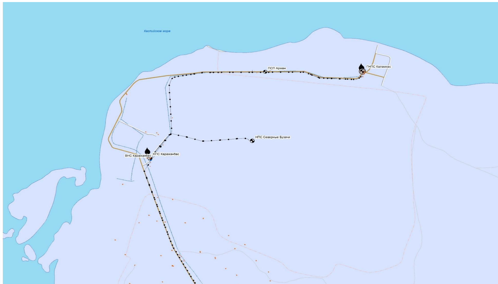
Рисунок 1. Ситуационная схема района расположения НПС «Северные Бузачи»