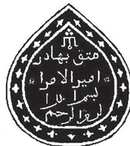
Қарқаралы дуанының әмірі Матақ батырдың мөрінің таңбасы

2015 жылы Қарағанды облысының мәдениет басқармасының «Тарихи және мәдени ескерткіштерді сақтау және қорғау бөлімінің» мамандары Матақ батыр кесенесіне күрделі жөндеу жұмыстарын жүргізді. Кесененің сырты темір шарбақпен қоршалды, тозған қабырғаның элементтері жаңартылды, айналасы ретке келтірілді. Матақ батыр кесенесі Қазақстан Республикасының мемлекет қорғауына алынған ескерткіштер қатарын енгізілді. Осы салтанатты шараға Қарағанды облыстық мәдениет бөлімінің мамандары, Қарқаралы аудандық әкімшілігі қызметкерлері, баспасөз өкілдері, аудандық мұражай қызметкерлері және Батырдың ұр-