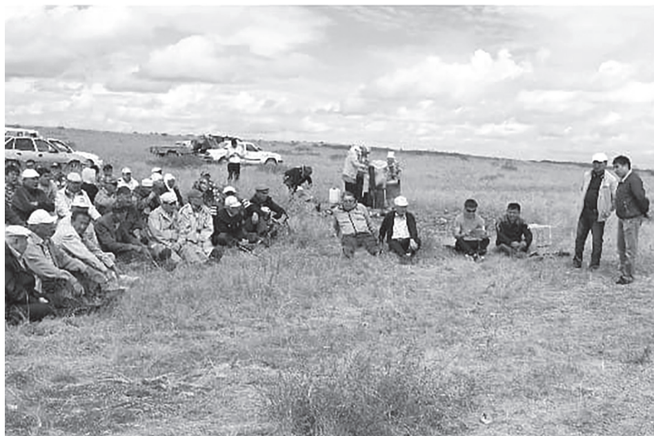
Матақ батырдың кесенесінде ас беріп Құран бағыштау. 2015 жыл