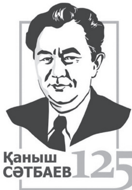
Қаныш СӘТБАЕВ 125

Ол Жезқазған-Ұлытау ауданының жер қойнауын барлағаны үшін 1940 ж. Ленин орденімен марапатталды. 1942 жылы оған геология-минералогия ғылымдарының докторы ғылыми дә-