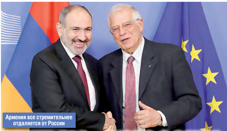
Армения все стремительнее отдаляется от России

В приоритете развитие отношений с соседними странами, уточнил он. Мирзоян добавил, что Армения строит «совершенно новые качественные отношения» с разными государствами, например с Индией.