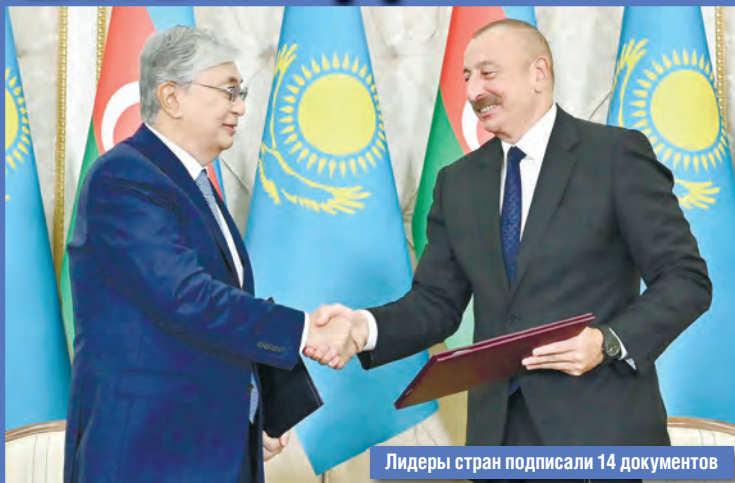
Лидеры стран подписали 14 документов

Азербайджанской Республики между АО «Национальная компания «КазМунайГаз» и государственной нефтяной компанией Азербайджанской Республики.