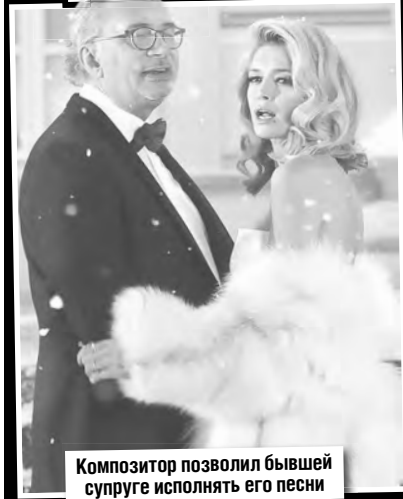
Композитор позволил бывшей супруге исполнять его песни