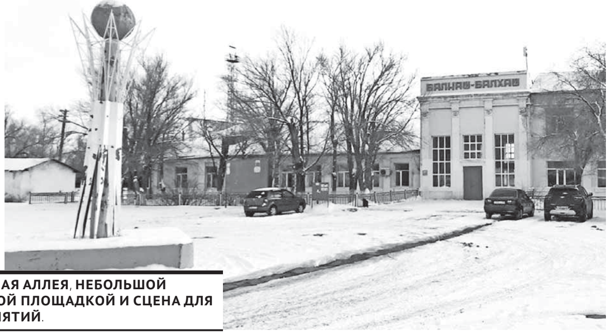
В РАЙОНЕ ПОВЯТЯТСЯ НОВАЯ АЛЛЕЯ, НЕБОЛЬШОЙ СКВЕР С ДЕТСКОЙ ИГРОВОЙ ПЛОЩАДКОЙ И СЦЕНА ДЛЯ ПРАЗДНИЧНЫХ МЕРОПРИЯТИЙ.