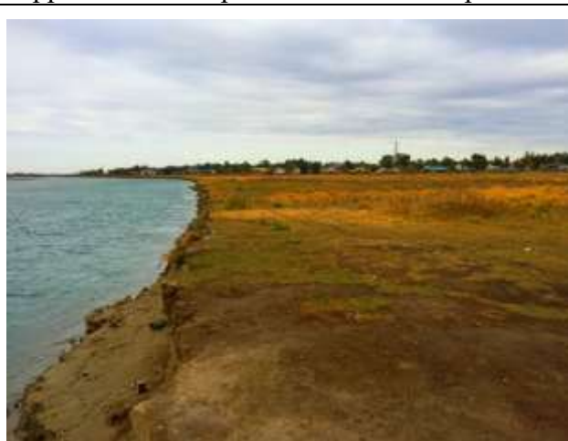
Фото 3.1.1. Поверхность террасы.

Поверхность террасы слабоволнистая, с уклоном в сторону реки и осложнена техногенными ямами, арыками, канавами глубиной 0,2...1,5 м и насыпями высотой до 1 м. Местами отмечено наличие пологих естественных водно-эрозионных депрессий глубиной 0,1...0,3 м (фото 3.1.1...3.1.4). Тыловой шов террасы прослеживается вдоль границы села и, как правило, погребен под покровом техногенных образований. Высота террасы вдоль берега изменяется в пределах 0,5...5 м.