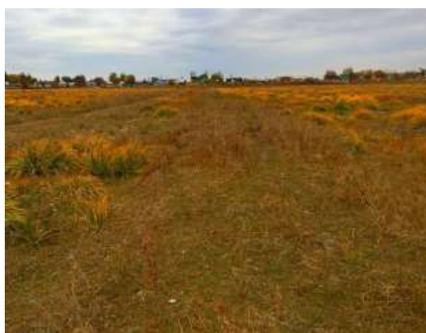
Фото 3.1.3. Техногенные насыпи.