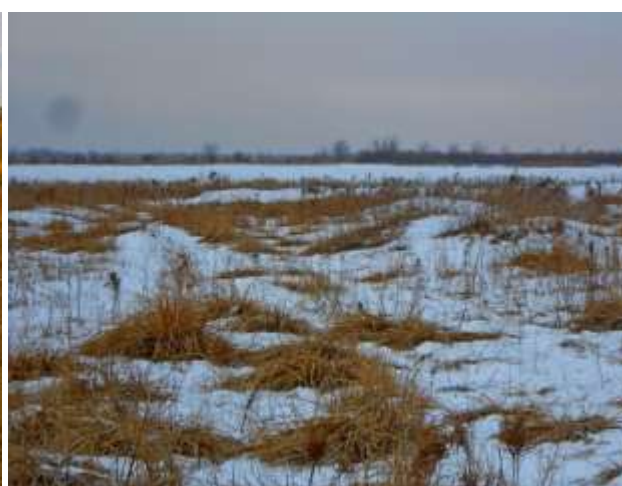
Фото 3.1.4. Техногенные выемки (зимний период).

Поверхность террасы поросла преимущественно травянистой и редкой невысокой кустарниковой растительностью.