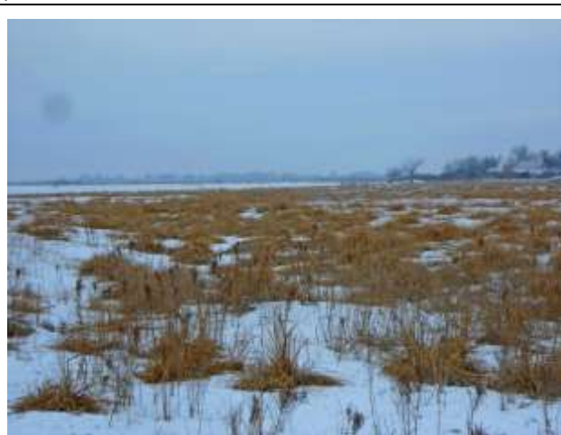
Фото 3.1.2. Поверхность террасы (зимний период).