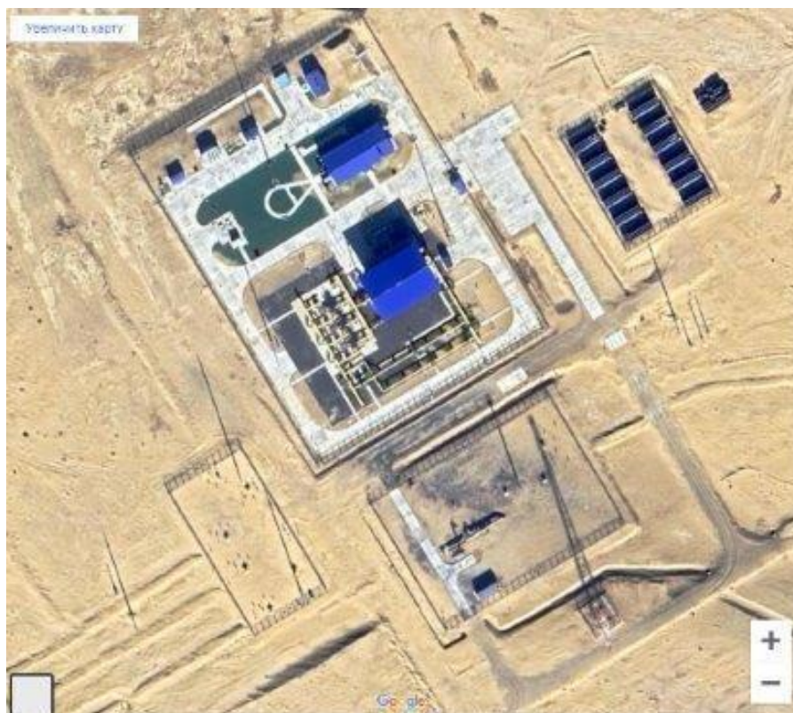
Рисунок 1.2. ГИС «Бейнеу»