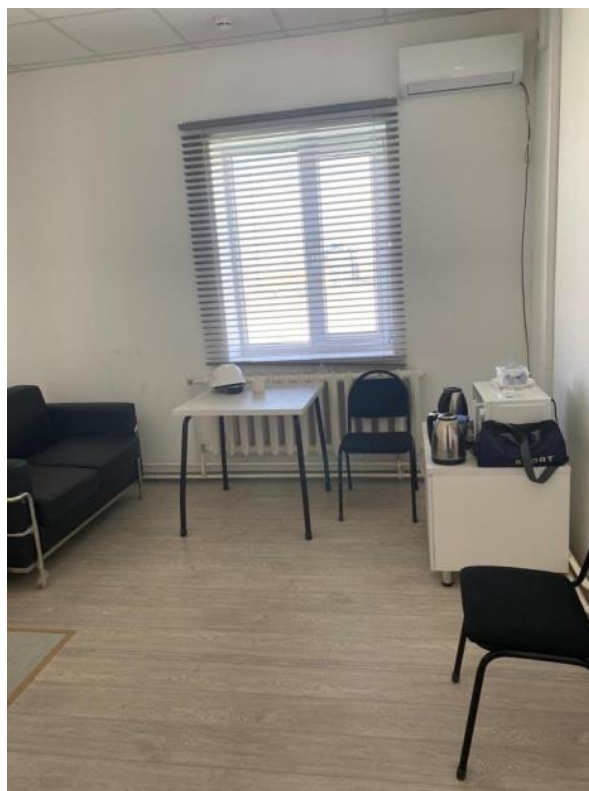
Рисунок 1.4. Комната для приема пищи на ГИС «Бейнеу»

Вахтовый поселок, столовая, медицинский пункт на территории ГИС «Бейнеу» - отсутствуют. В здании операторной на ГИС «Бейнеу» есть комната для приема пищи (рисунок 1.4).