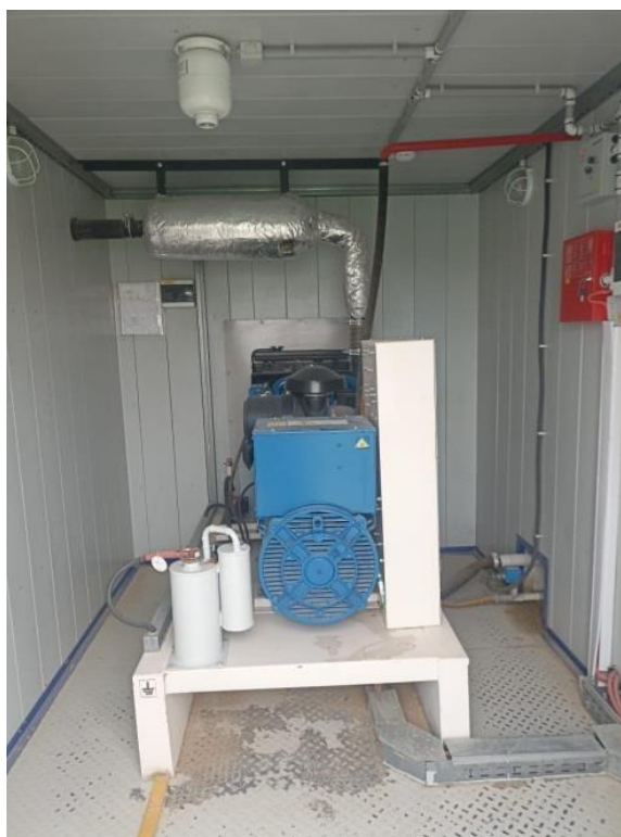
Рисунок 1.3. ДЭС на ГИС «Бейнеу»