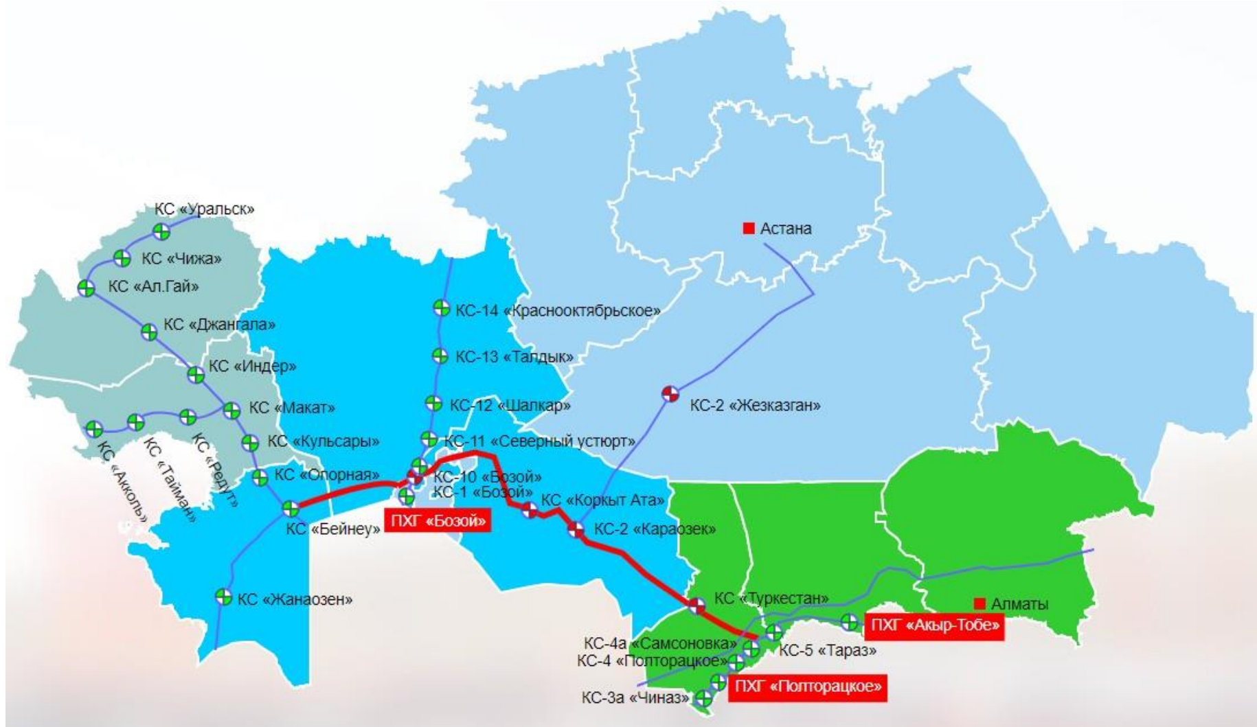
Рисунок 1.1. Общий вид газопровода «Бейнеу-Бозой-Шымкент» (красная линия)