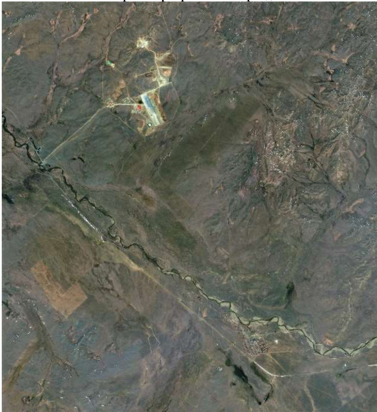
Рис. 1.2 - Обзорная карта района месторождения Алмалы