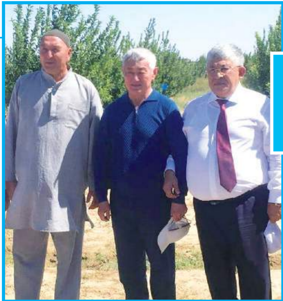
(Жалғасы. Басы 1-бетте)