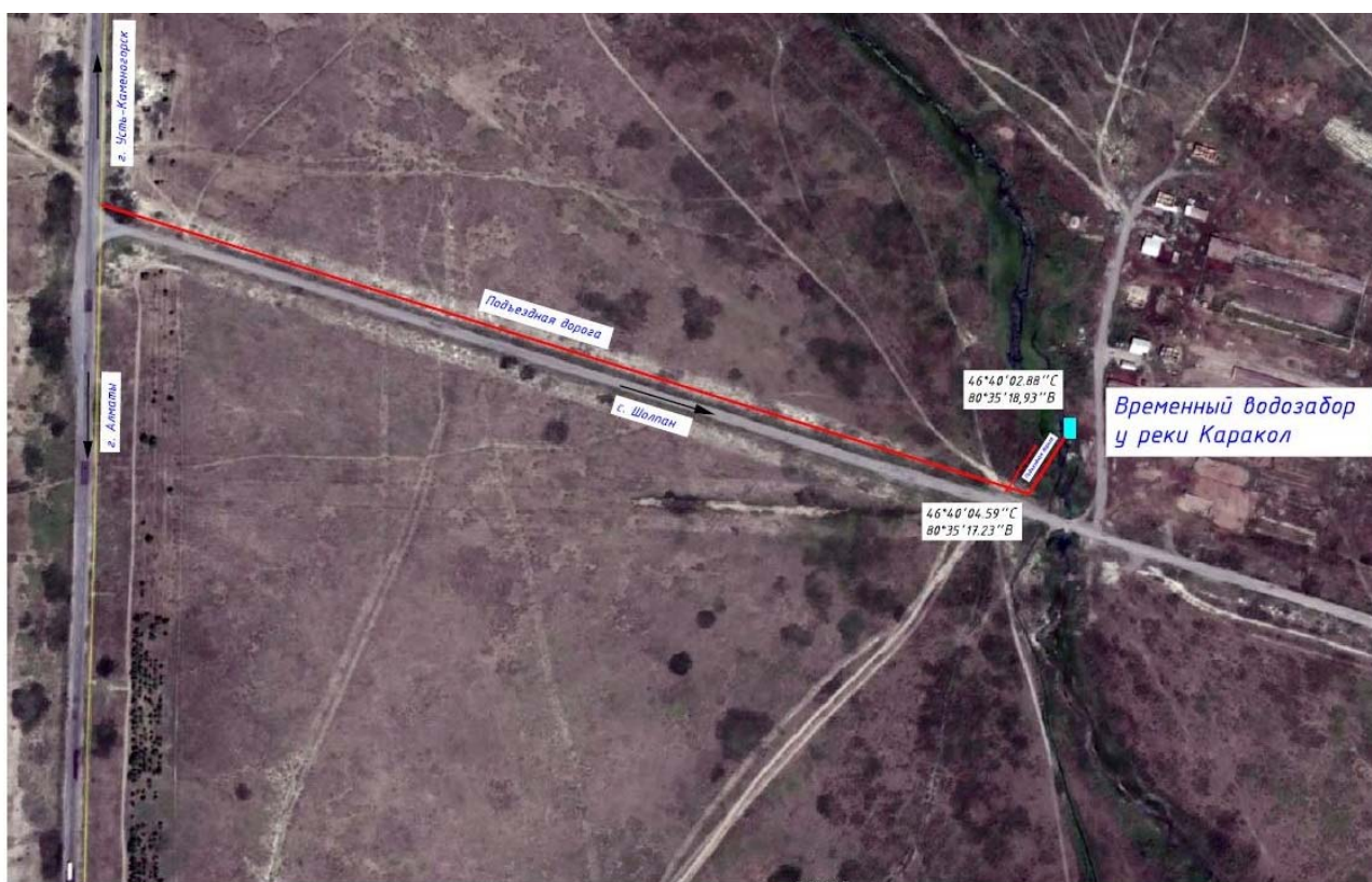
Рисунок 3.1.2-1 – Схема временного водозабора у р.Каракал

Расчет воды на хозяйственно-питьевые нужды осуществляется согласно СНиП РК 4.01-41-2006. Обеспечение безопасности и качества воды должно обеспечиваться в