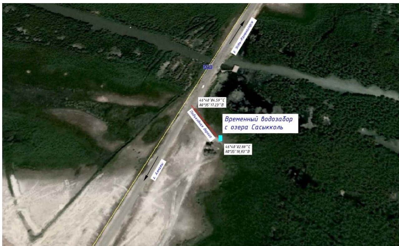
Рисунок 3.1.2 – Схема временного водозабора с оз.Сасыкколь

Расстояние от временного водозабора до точки примыкания к автодороге Алматы – Усть-Каменогорск 5,22 км.