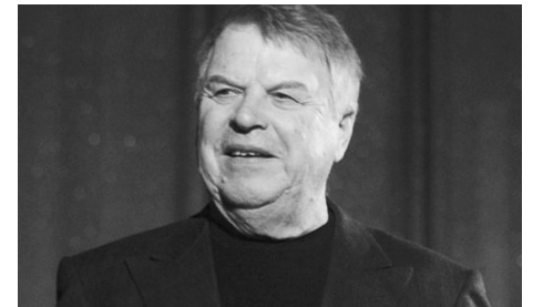
В последние годы Михаил Кокшенов почти не снимается

В последние годы Михаил Кокшенов снимался значительно реже. Он появлялся в эпизодах популярных сериалов «Папины дочки» и «Воронины». Его последняя режиссерская работа, «Театральный капитан» с Алексеем Паниным, снятый в неожиданном для Кокшенова драматическом жанре, вышел в 2006 году.