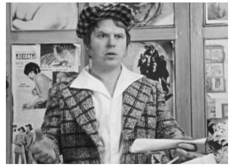
Михаил Кокшенов в фильме «Не может быть!»

В 1973 году местом работы актера становится Центральная студия киноактера. С этого дня съемки в кино стали основной частью его жизни — в год выходило по несколько фильмов с его участием. В 1975 году Кокшенов получил роль соседа «балерины из дворника» Софи в комедии Леонида Гайдая «Не может быть!».