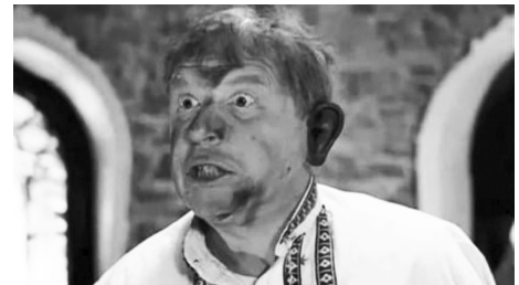
Кадр из фильма «На Дерибасовской хорошая погода...»

ся на плаву, он проговорил текст, а потом едва живой вылез на лодку. Первым, что он услышал после, был громкий вопль женщины, ответственной за костюмы: «Где сапоги?!».