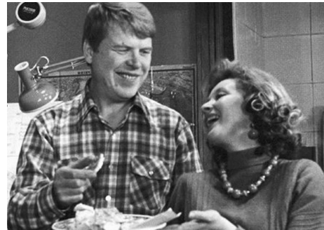
«Самая обаятельная и привлекательная»: Михаил Кокшенов в роли Пряжина

Сам актер в жизни всегда был антиподом своих героев, таким маскирующимся под простака интеллигентом, но никогда не жалел о выпавшей стезе. По его мнению, ампула комедийного героя — самое сложное, «оно вне политики, вне возраста — вечное». Мастером комедии и личным примером Кокшенов считал Савелия Крамарова, с которым он познакомился, поступив в 1974 году на службу в Театр Киноактера.