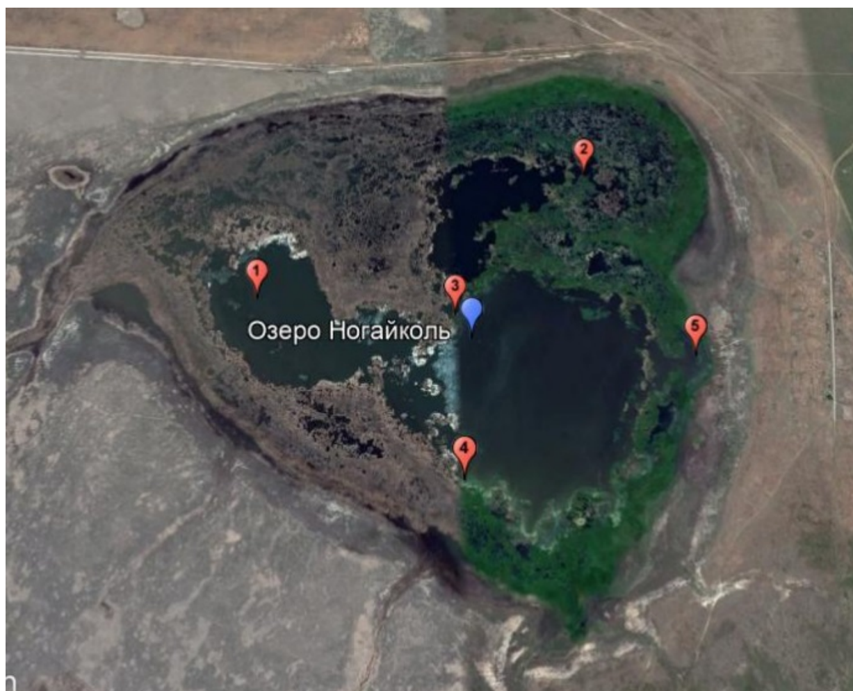
Рисунок 2. Станции отбора проб.

Станции отбора проб на озере Ногайколь находились у берега, в открытой части и на середине водоема (рисунок 2).