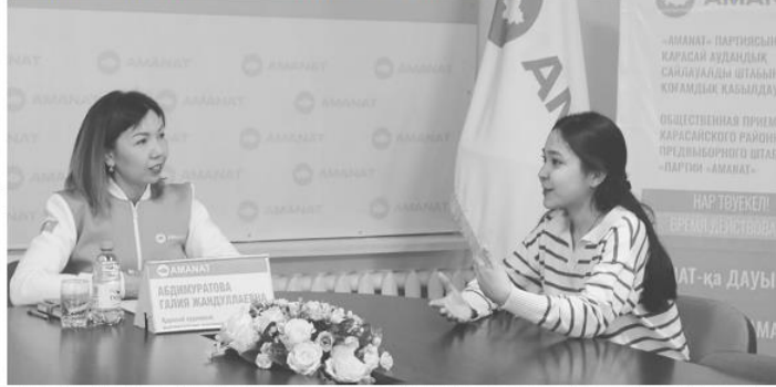
«АМАНАТ» ПАРТИЯСЫНЫҢ ҚАРАСАЙ АУДАНЫДЫҚ САЙЛАУДАҒЫ ШТАМАН ҚОҒАМДАҚ ҚАЗЫЛАУ