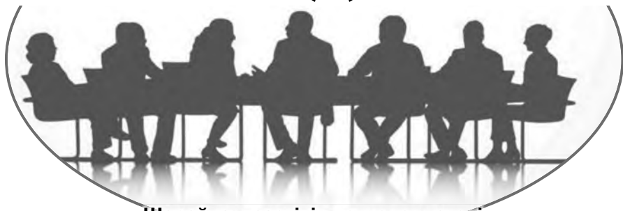
«Шарайна» газетінің дөңгелек үстелі