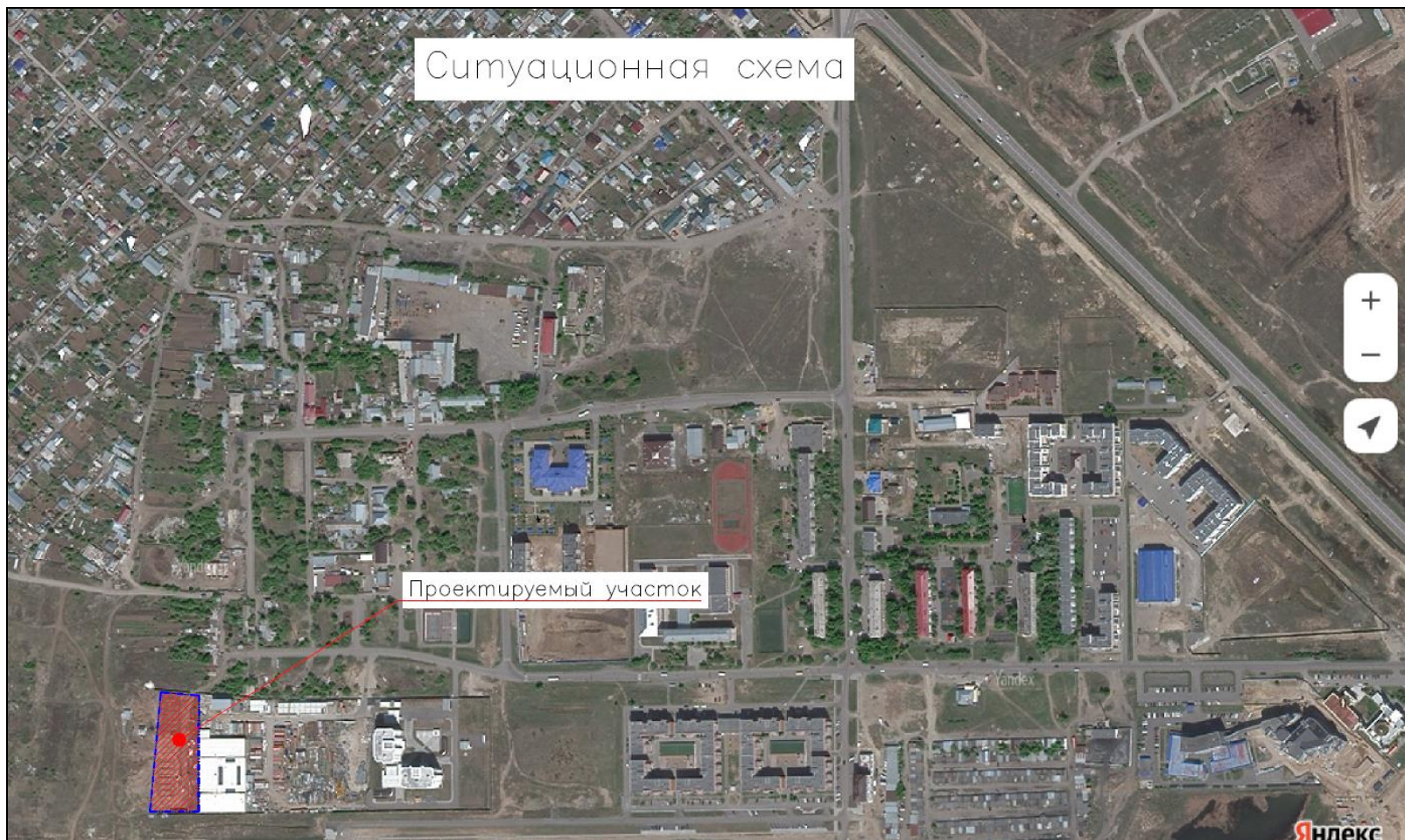
Рисунок 1 - Ситуационная карта-схема размещения участка строительства