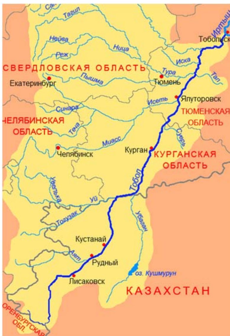
Рисунок 2.1. Схема бассейна реки Тобол

Тающие снега являются наиболее важным источником питания Тобола, вниз по течению возрастает доля дождевого.