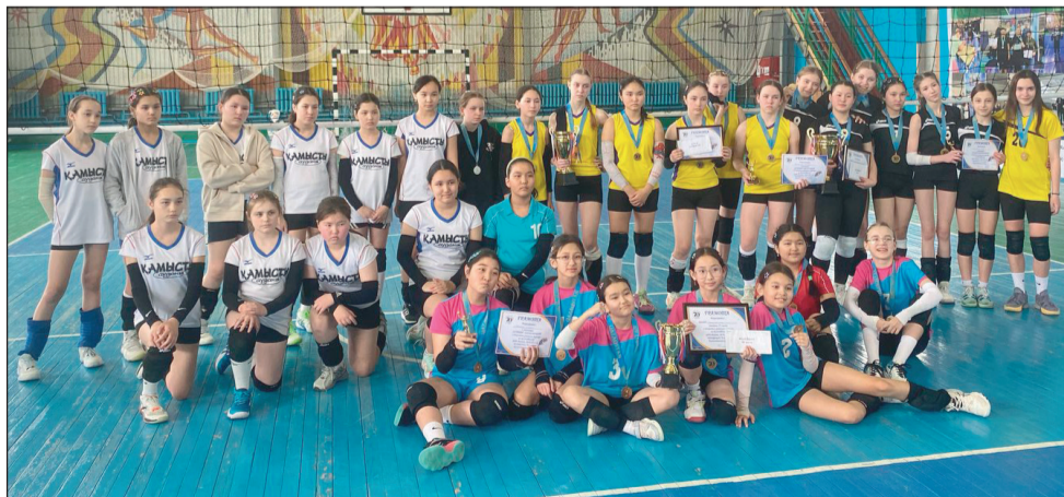
Волейболисты показали высокий уровень владения мячом