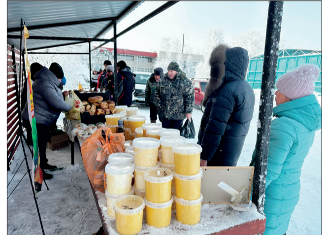
Широкий ассортимент продукции на ярмарке порадовал сельчан

Дни села Алтынсарино в Камысты начали эстафету