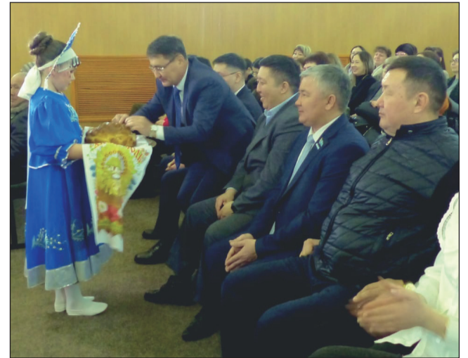
По традиции угощали шашу и караваем

которой приняли участие предприниматели Денисовского и Камыстинского районов, города Костаная. В широком ассортименте были представлены мясная, колбасная, молочная продукция, кондитерские и хлебобулочные изделия. Сельхозсектором района были доставлены сено, зерноотходы, ячмень. Данные наименования в конце зимовки особо были востребованы владельцами личных подсобных хозяйств. Всего реализовано 31,8 тонны товаров на сумму 2 млн 450 тыс. тенге.