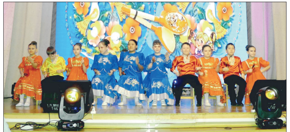
Юные алтынсаринцы проявили свои таланты

Редакция может публиковать статьи в порядке обсуждения, не разделяя точку зрения автора. Ответственность за рекламу несет рекламодатель. Компьютерный набор редакции, печать офсетная, объем – один печатный лист.