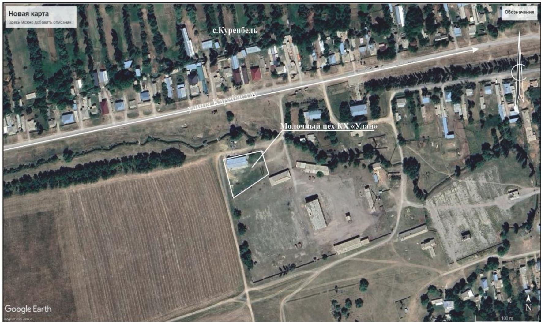
Рис.1. Ситуационная схема расположения объекта Жуалынский район Жамбылская область (M1:200)