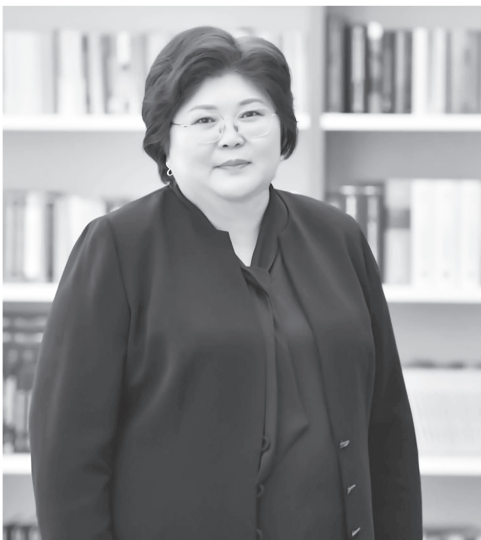
Эльвира АЗИМОВА, Қазақстан Республикасы Конституциялық Сотының төрағасы:

Тәжірибе әлі де жинақталуда. Аппараттың қызметкерлері бізге өтінішпен жүгінген азаматтарға түсіндіру жұмыстарын белсенді жүргізіп отырады. Себебі өтінішті рәсімдеу, нұқсан келтіруі мүмкін болған норма-