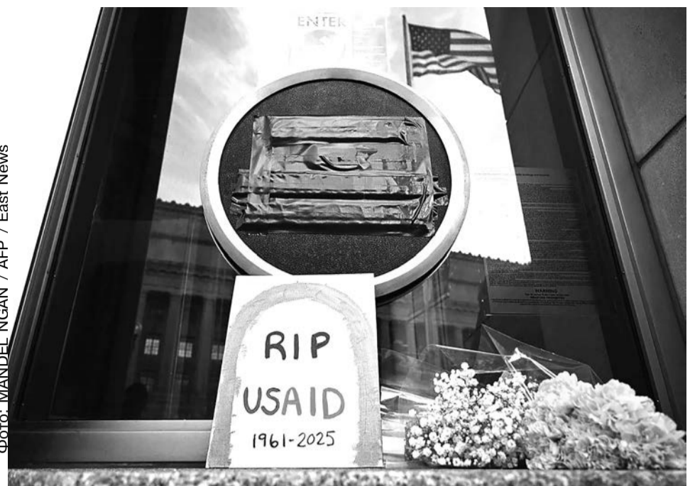
Штаб-квартира Агентства США по международному развитию (USAID). 7 февраля 2025 года

в стране и так прокомментировал это решение: «TikTok в основном предназначен для детей, маленьких детей. Если Китай собирается извлекать из него информацию о маленьких детях, честно говоря, я думаю, у нас есть проблемы посерьезнее».