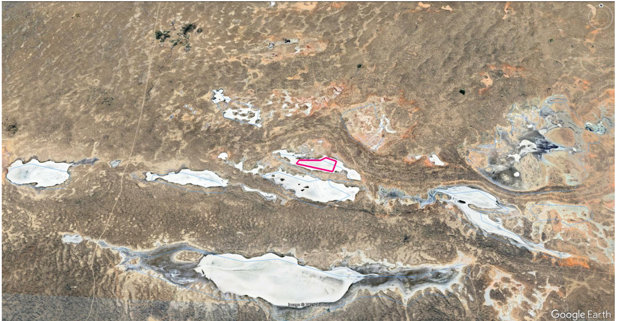
Рисунок 1.2. Карта-схема территории объекта с указанием источников загрязнения