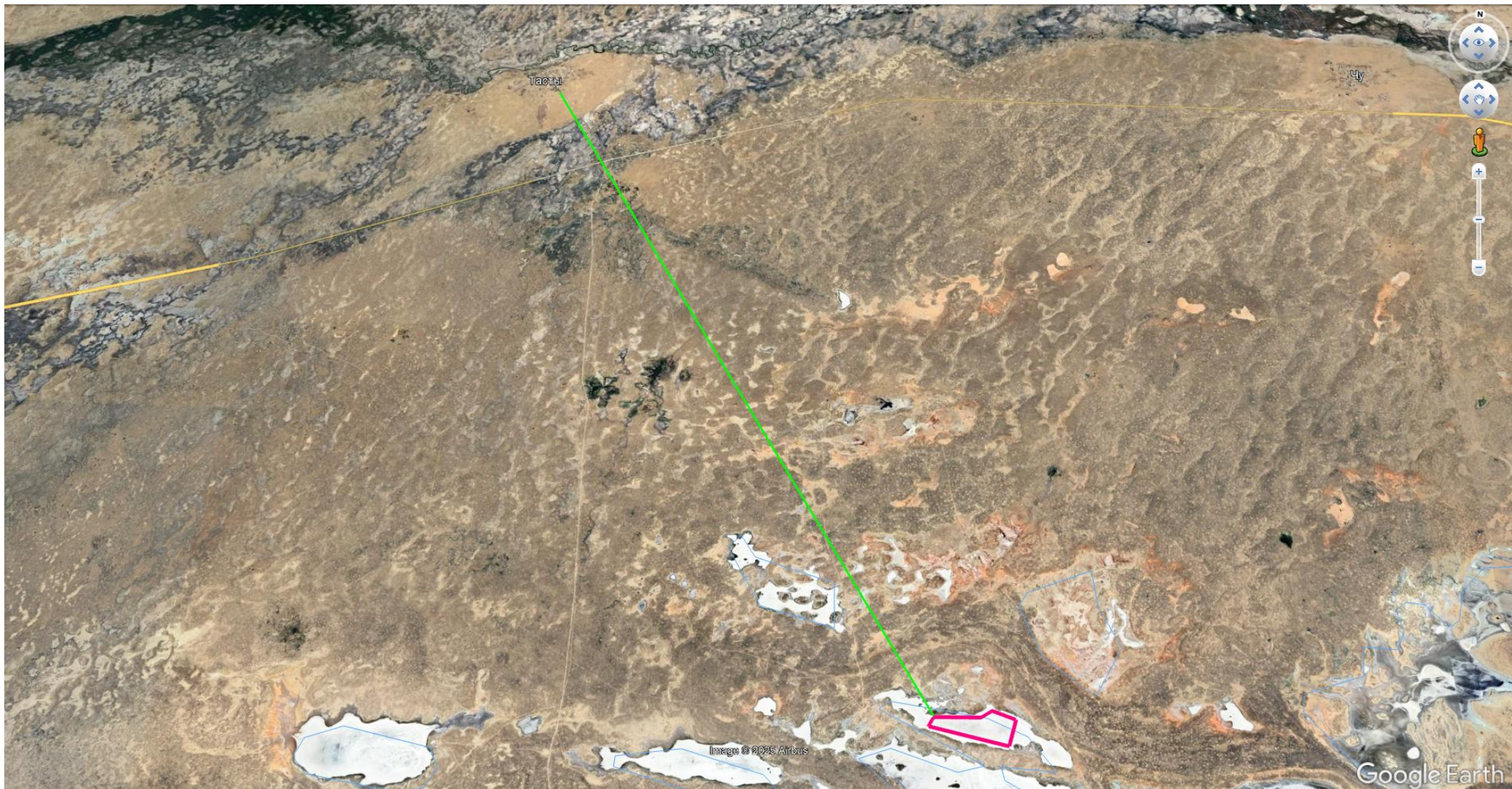
Рисунок 1.1. Обзорная карта района расположения объекта