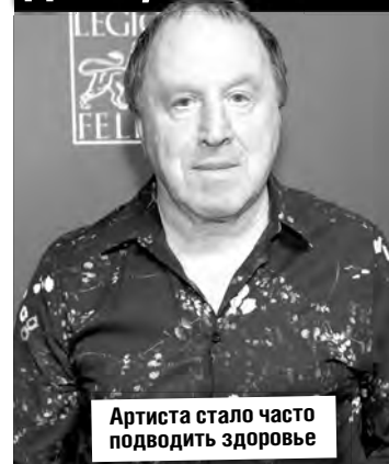
Артиста стало часто подводить здоровье