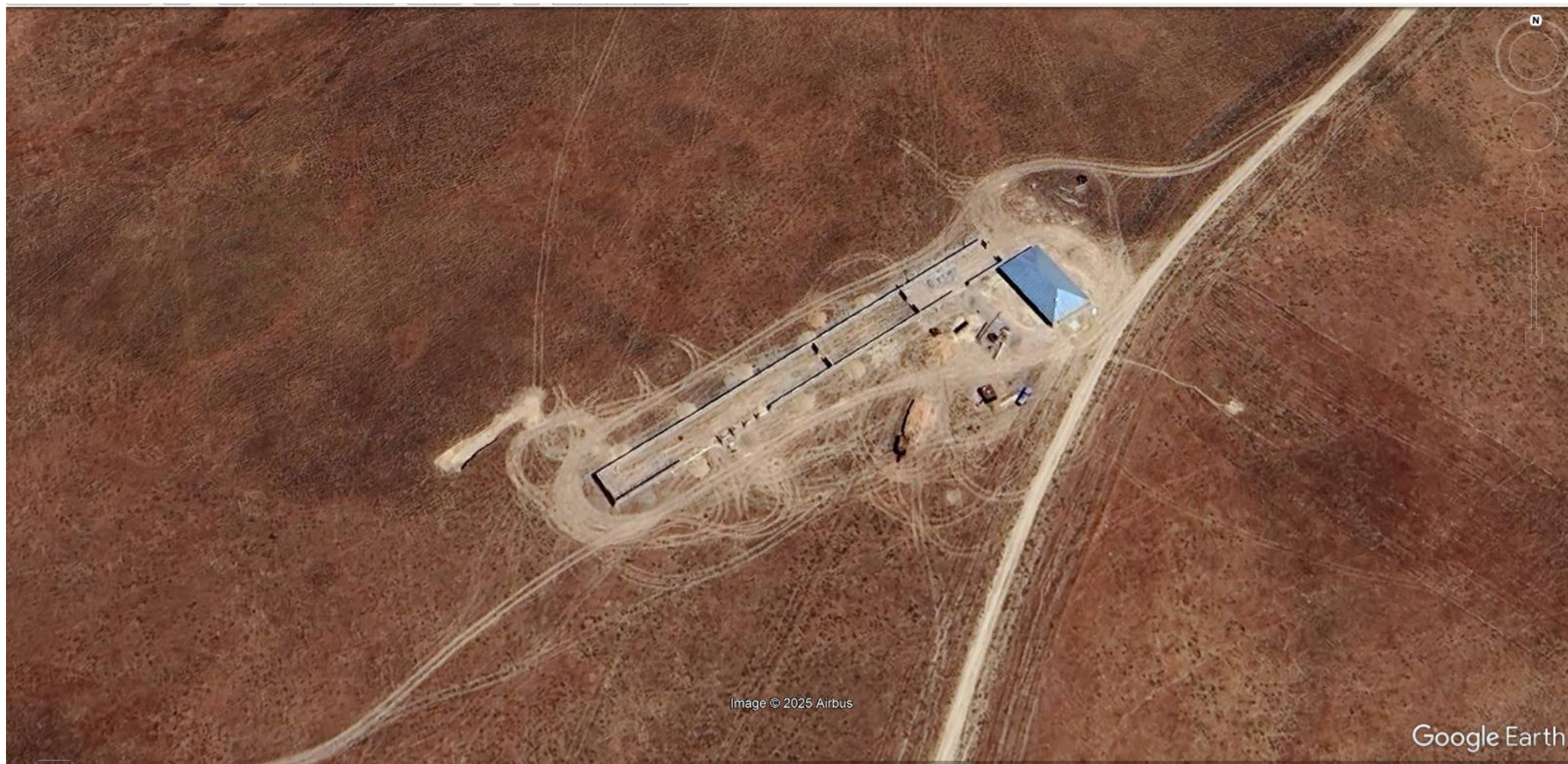
Рисунок 1.3. Карта-схема территории объекта с указанием источников загрязнения