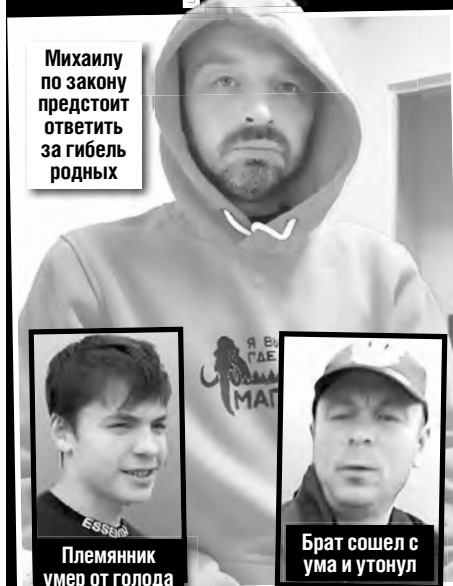
Михаилу по закону предстоит ответить за гибель родных