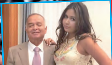
Мариам тепло говорит о дедушке